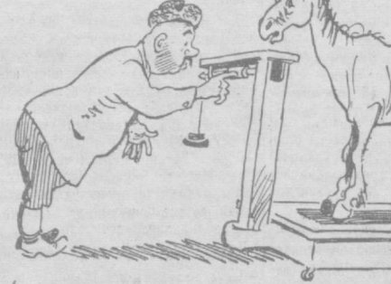
РАНС — Вой буй мучча озиб кетибсан, ақалли ярминг ҳал қолмабдикун? ОТ — Туппа-тузуқ эдимку, сушилмада тура бошлаганимдан бери жирим қўриб, терим суякка бориб ёпишди. М. Воробейчиков чизган расм.