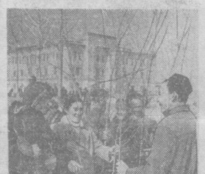
Баҳор ойлари бошланиши билан пойтахтимиз кўчалари ва ховли-хўжалиқ дарахт кўчатлари ўгнани қизғин тус олди. Суратда: Тошкентнинг Октябрь бозорига меҳнатнашларга дарахт кўчатлари сотиш пайти.