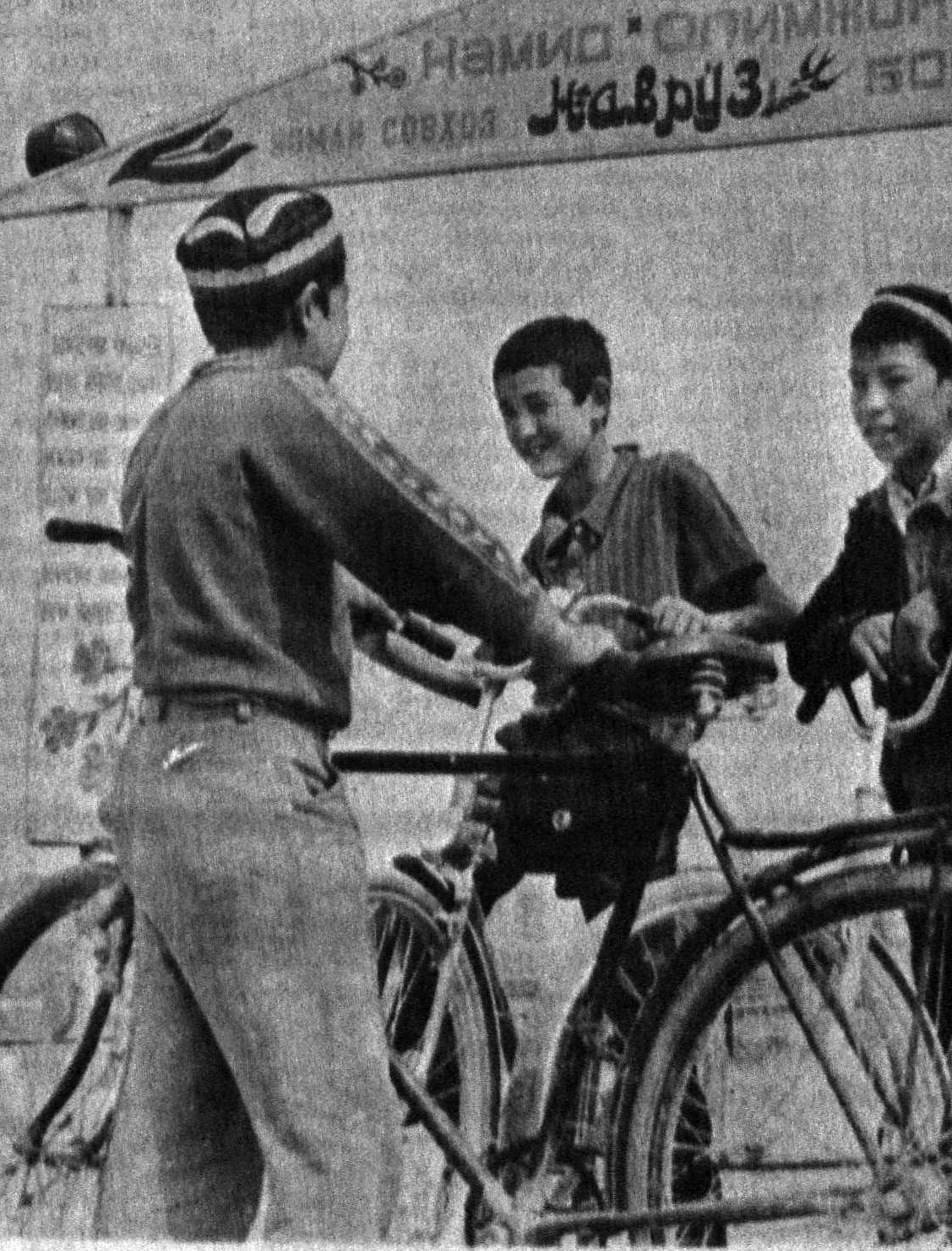
Ниҳоят, орзу ушадди. Булуғунур ноҳияси Х. Олминов номи давлат ҳўжа-лиғи аҳли бўш вақтларини қўнғилил ў-қаниш имконини эга бўлдилар. Ҳў-жалиқнинг 2-бўлим марказида барпо этилган бу боққа «Наврўз» деб ном бе-ришиди. Богда турли байрам, халқ сийла-рини, спорт мусобақаларини ўтказиш, маданий дам олиш, қордиқ чинари учун ҳамма қўлайликлар муҳаб! Айнакка, ҳўжалик ёшлари бундан беҳад хурсанд.

«Момом эртаяк айтади»... «Авал боқининг калтагини ердик. Кейин босмачи чиқди...» Кейин аскер... Ким талаб, жим ҳимоя қил-гани ёлғиз яратганга аён. Биз, уни-си келса ҳам, буниси келса ҳам беқиниб олардик... Ҳақиқатчилик хурсанд. Қиш-лоқ йўли асфальт бўлибди. Ҳар сафар борганимда, «шу йўлни бо-лаб бир «Муштумга ургин» дейи-шарди. Ҳеч қўлим тегмасди. Тў-риси, аъганим билан фойдасиз деб ўйлардим. Энди бўлса, йўл қуриб битказилибди. Ҳавасинг келади. Ойнадек, теп-текис. Ишич-деҳқон инқилбининг галабасига ҳам етмиш йилдан ошиб қолди... Қишлоқдош-ларим хурсанд. (Йўл учун бир не-ча марта пул йилганим ҳам унут бўлган). Яқинда автобус юра бош-лабди. Давлатдан яна бирор нәрса сўраш... уят эмасми!..