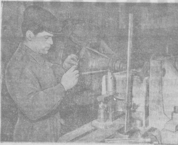
«Ўзбекхлопкомаш» заводидан илгари бажарилган муddатидан олдин бажариш учун...