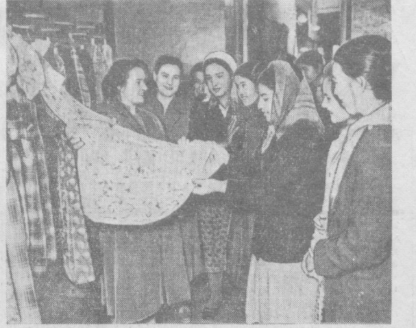
Янгйўд шаҳар Маданият уйи об-...