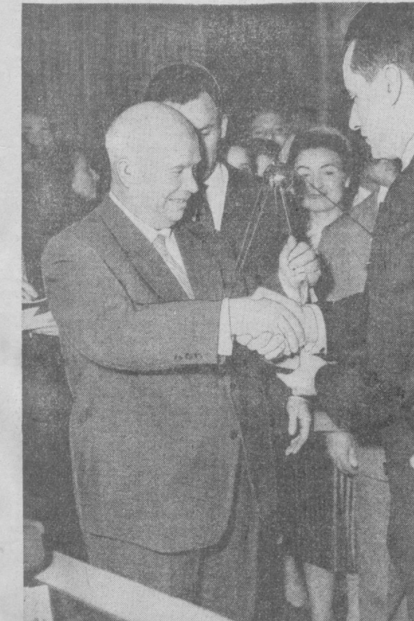
Н. С. Хрущев Бордо шаҳрининг элчи Франция Миллат мажлисининг раиси Ж. Шобан-Дельянига табриқламоқда.

қарор қилиш ва қурилиш ишлари-нинг ҳажми 1959 йилнинг бирин-чи кварталда амалда бажарилган иш ҳажмидан 217 процент кўп бўлди. Қурувчилар 1960 йил иккинчи квартал планини ошириб бажаришга қатъий бел боғладилар.