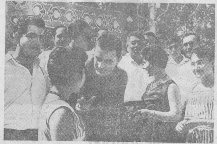
Карнавал — ёшлик, дўстлик, кувноқин байрами. Дарҳақиқат пойтахтнинг Ленин комсомол номили маданият уйида иштирок борида ўтказилган «Дўстлик карнавали» турли миллат ёшларининг шодона кунини, биродарлик байрамига айланди. Суратда: Тошкентда тазйим олаётган ва карнавалга келган грек, ҳинд ва судан қизлари.

НИКИНЧИ ПРОГРАММА Рус тилида: 19.00 — Ички мото полк (болалар учун фильм); 19.15 — Кинобор оламиди; 19.35 — Лев Толстой ва музика; Ўзбек тилида: 20.50 — Ўзбек бошқаруви янги кашфиёти; 21.10 сўз — «Ташавтомаш» заводи ходимлари; 21.30 — Фотима номили бадий фильм.