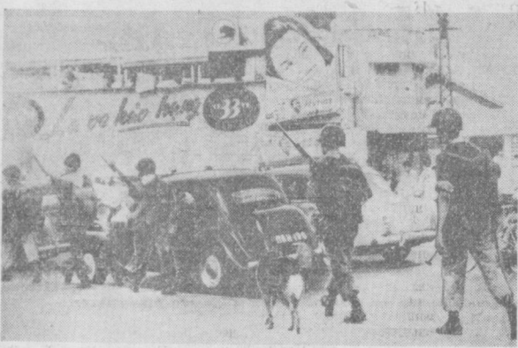
Жанубий Вьетнам. Суратда: Нго Дин Дьем солдатлари Сайгон кўчаларида патрулик қилиб юришди.

НЬЮ-ЙОРК, 13 сентябрь. (ТАСС). Президент Кеннеди ўзининг кенгаши мабурут конференциясида сенатга мурожаат қилиб, атмосферада, носмик фаола ва суи остида ядро ку-роли синовларини тақрирлаш тўғри-риндаги Москва Шартномасини «мумкин қадар энг кўп овоз билан» маъқуллашни яънисос қилди.