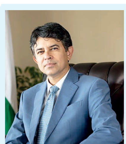
Чрезвычайный и Полномочный Посол Республики Индия в Узбекистане Маниш ПРАБАТ:

Пресс-служба Посольства Индии в Республике Узбекистан.