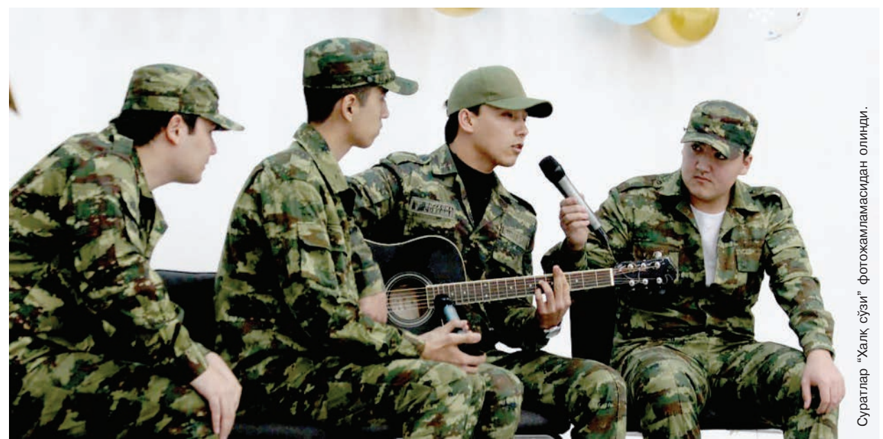
Суратлар "Халқ сўзи" фотожамнамасидан олинди.

тринаси асосида ҳарбий-маъмурий секторлар ташкил этилди, маҳаллий бюджет маблағлари ҳисобидан ҳарбий хизматчиларга муносиб иш ва турмуш шароитлари яратиб берилмоқда. Миллий армиямизнинг минтақавий, халқаро рейтинглардаги, ўтказилаётган ҳар хил мусобақалардаги кўрсаткичлари юқориламоқда. — Миллий, минтақавий ва глобал хавфсизликка қарши турфа таҳдидлар пайдо бўлаётган бугунги кунда халқимизнинг тинч ва осу-