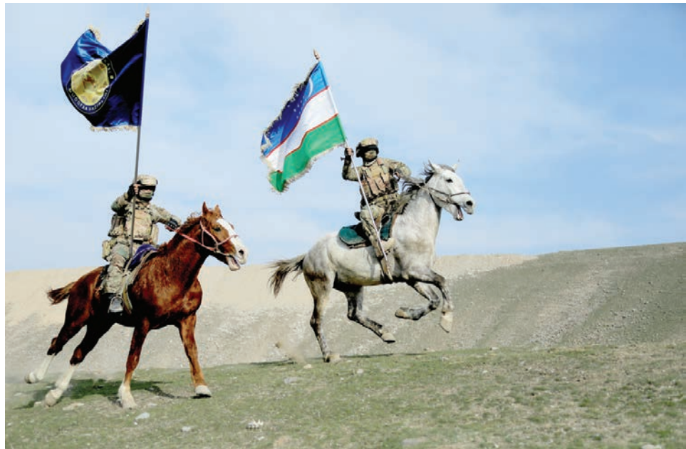
Темур ЭШБОЕВ («Халқ сўзи»)

Ватан ҳимоячилари кунига бағишланган бундай тадбирлар вилоятнинг турли қорхона ва ташкилотлари, маҳаллаларида ҳам давом этмоқда.