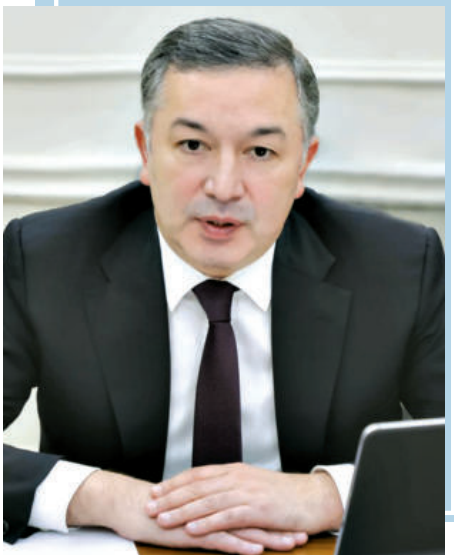
Беҳзод МУСАЕВ, камбағалликни қисқартриш ва бандлик вазири