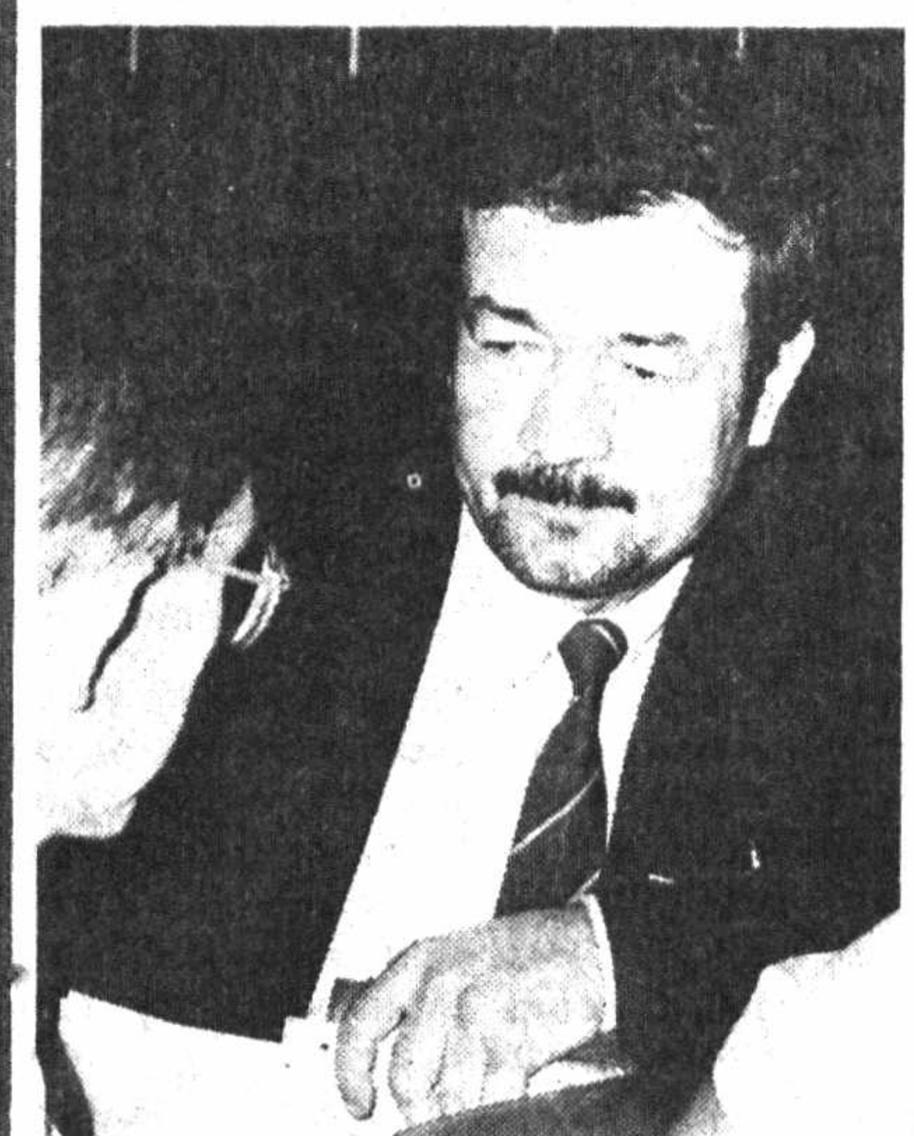
— Қайқа қараманг, кўнгилсизлик. Пустроғи шиллинг нарх, ярадор тў, узани саҳрога айланган дарё кўршовидамиз. Ҳозирда яна бир оқим пайдо бўлди. Аҳолини ишга жойлаштириш баҳонасида соҳил ёқеси, сулим масканларда бизга ёт заводлар қурилиши. Бу ҳақидаги гап гоҳ у воҳа, баъзида бошқа ерлар эшитилмоқда. Ҳатто айрим «халқпарварлар» дарё устида цемент заводи қурилса ҳам атрофга зийни йўқ, деган даъвоини қилишапти.

— Юракнинг ўришга тош битан бўлса, ундан оғир йўқ. Бедаво у Афсуски, раҳбарларимиз ичиде ундайлар кўп. Бу ҳақида узун-кўч уйлаганиданими, эсласам бошим оғрийд. Табиатга зийн келтириш нима оқибатларга сабаб бўлиши кўпчиликка аён. Айтадиганларининг ҳаммаси алғов-делғов бўлган табиат тўғрисида асарлар. Унинг асорати оғир бўлади. Хош инсон ёки она замин танида бўлсин, барибир, боқбармас. Инилдан-йилга касаллик тури ортиб борапти. Айримларнинг номи ҳали ҳам номалум. Беморнинг тузалиши оғир кечмоқда. Хасталар сони ҳақдан ошганидан хасталонларда жой йўқ.