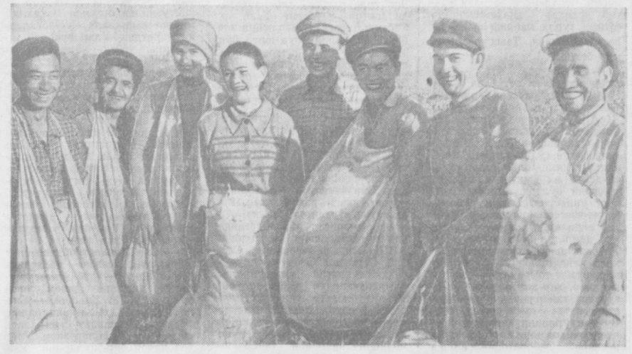
Чирчиқдаги трансформатор заводининг бир гуруҳи ишчи ва хизматчилари шу кунларда Урта Чирчиқ бошқармасидаги Калинин номи колхоз деҳқонларига пахта теримда яқиндан кўмаклашмоқдалар. Уларнинг ҳар бири ўрта ҳисобда 60—70 килограмдан пахта териб, колхозчиларнинг самийи ҳурматига сазовор бўлайти. Фотомуҳбириниз В. Салов олган мана бу суратда ана шу сержант кўмакдошларининг бир гуруҳасини кўриб турибсиз.