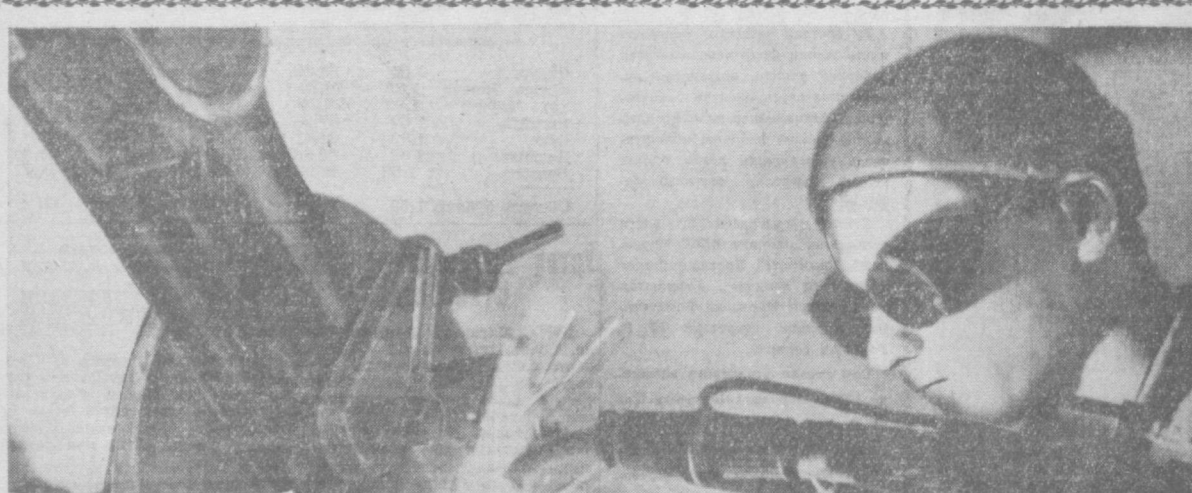
«ТОШКЕНТ ҲАҚИҚАТИ» 2-БЕТ, 16 ОКТАБРЪ, 1963 ЙИЛ.

«Шахса сизнинг қоралимаганида, унинг зарарли оқибатлари йўқотилмаганида... партия ва мамлакат қандай аҳволда қолар эди. Бундан бўлганда, партиянинг оммадан, халқдан ажралиб қолиши, совет демократияси ва революцион қонунилик жиҳиди суръатда бузилиши, мамлакат иқтисодий тараққиётининг сустлашиши, коммунистик қурилиш суръатларининг пасайиши, бинобарин, меҳнатчилар фаровонлигининг ёмонлашиши ҳаффи ҳам туғилар эди. Бу ҳол халқро муносабатлар соҳасида Совет Иттифоқининг жаҳон майдонидаги позицияларининг заифлашувига бошқа мамлакатлар билан муносабатларининг ёмонлашувига олиб келар эди, бунинг оқибаatlари жаҳон аҳоли бўлар эди».