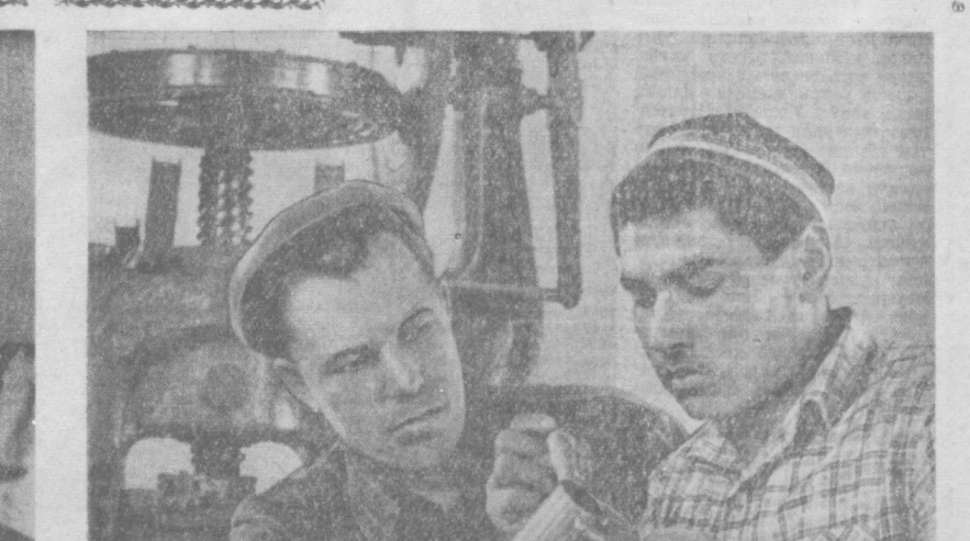
«ТОШКЕНТ ҲАҚИҚАТИ» 2-БЕТ, 16 ОКТАБРЪ, 1963 ЙИЛ.