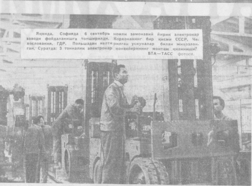
Яқинда, Софияда 6 сентябрь номи замонавий йирини электронар заводи фойдаланишга топширилди. Корхонанинг бир қисми СССР, Чехослования, ГДР, Польшадан келтирилган ускуналар билан жиҳозланган. Суратда: 3 тонналик электронар конвейернинг монтаж қилиниши.