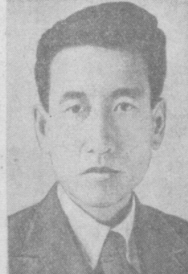
Т. ЭМ Колхоз раиси

Тўпланганлар Л. И. Брежневни ва унинг ҳамроҳларини қизғин ва самимий кузатдилар. «ИЛ-18» маҳсул самолети осмонга парвоз қилиб жанубга қараб йўл олади. Совет кишилари Л. И. Брежневнинг Эронга визити ҳар иккала мамлакат халқлари манфаатлари йўлида ва бутун дунёда тинчликни мустаҳкамлаш йўлида Совет-Эрон муносабатларининг янада ривожланишига ёрдам беради, деб ишондилар. (ТАСС).