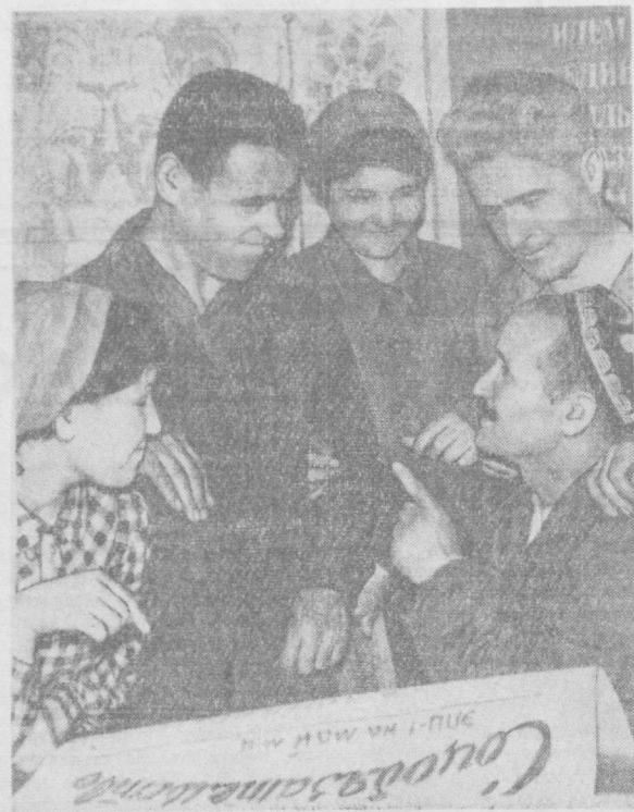
Тошкентдаги карборунд заводда қисқартирилган иш кунига ўтилгандан сўнг маҳсулот ишлаб чиқариш камаймади, балки аксинча янада кўпайди.

Бондан бери дугоналарнинг гапини эшитиб турган эдик таёрлаш дехининг бошлиғи