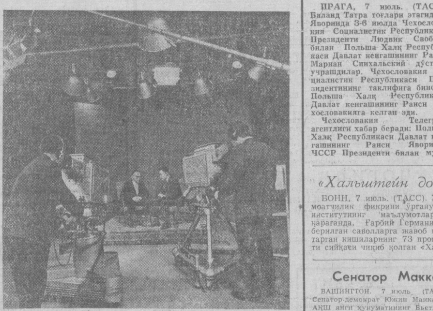
УЛАН-БАТОР. Оқшом тушини билан Монголиянинг шаҳар ва кишлоқларида, юзлаб хонадонларда «аэрогори экран»лар ишляпти. «Октябрь 50 йилдиги» номили марказий телевизион «Октябрь 1967 йил сентябрдан бошлаб ишга тушрилган. Мазкур телевизион маркази Совет Иттифиқи ердаида қурилган. Суратда: Улан-Батор телевизион марказида эшитириш олиб боришмоқда.