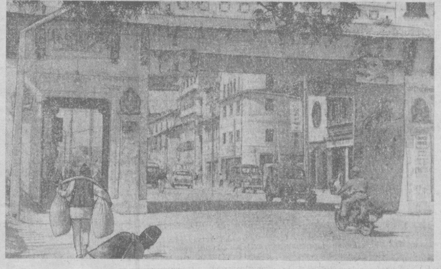
НЕПАЛ. Катмавул шаҳрида охириг йиллар ичида чет эллардан соғитиб олинган автомобилларнинг сон кўпайиб бормоқда. Бу ерда Совет Иттифоқидан келтирилган «Волга» ва «Москвич» автомашиналарини ҳам кўриш мумкин. Суратда: шаҳарнинг марказий дарвезаларидан бири.

тиқ, фан ва техника соҳасида ҳамкорлик ривожлантириб борилади. Сессия чоғида ҳар икки томон ўз ҳукуматларининг СССР билан Франция ўртасида ҳамма соҳалардаги муносабатларни ривожлантириш йўлига, совет ва француз халқлари ўртасидаги ҳамжиҳатлик ва дўстликни мустаҳкамлашга амак қилиб, ҳар иккала мамлакат ўртасидаги самарали илмий-техника ва иқтисодий ҳамкорликни кенгайтириш ва узоқ мудатли заминга қўйишга қаттиқ аҳд қилганликларини изҳор этдилар.