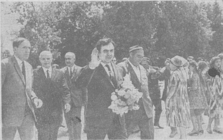
Сурия Араб Республикаси партия-давлат делегацияси аъзолари Тошкент тўқимачилик комбинатида.