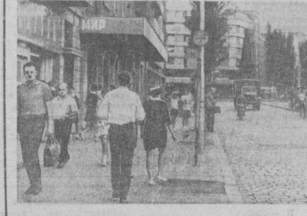
Болгариянинг пойтахти София шаҳрида майдонларнинг номи Болгар совет дўстлигининг мустақкам инфо-дасини тасдиқлайди. Бир қатор марказий кўчаларига Совет Иттифонини номаёндалирининг номлари қўйилган. Суратда: шаҳарнинг Волгоград хўбони.

ФОЖИЛИ НАТИЖА ЖЕНЕВА, 16 июль. (ТАСС). Швейцарияда шу йил апрел ойида юрак ўрнатилиш операцияси ўтказилган эди. Шу мамлакатдаги ана шундай операция натижасида янада юрак ўрнатилган бемор вафот этди. Йорқда эълон қилинган хабарга қараганда бу беморнинг ўлимга юқумли касалда учирганили сабаб бўлибди.