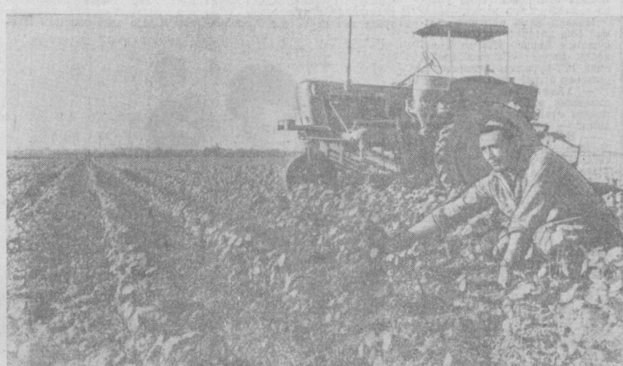
Эрта Чирчиқ районидagi «Партия XXII съезде» колхозининг Шайраза Мирзаев бошлик экинсизда гўзалар жуда яхши ўсмоқда. Бу экин аъзолари гектардан 35 центнердан ҳосил етиштириш юзасидан олган социалистик мажбуриятларини шараф билан бажариш учун июль ойи охиригача ҳамма майдондаги гўзаларни яна икки марта парварши қилишни мўлжалламоқдалар. Суратда: экин бошлиги Ш. Мирзаев гўзаларни кўздан кечираётган.

ениб ўтишди. Шу кунларда бригада аъзолари экинларни парварши қилиш билан бирга етилган сабаботларни сифатли секланган холда шаҳарликларга етказиб бермоқдалар. Бригада аъзолари шу кунга қадар 50 тоннадан зиёдроқ турли сабабот маҳсулотлари топширидилар. — Бизда,— дейди колхоз партия ташкилотининг секретари Р. Азимов,— бригадалар ўртасида социалистик мусобақа ҳар томонлама қизитилган. Илгор бригадаларни раёбатлантириш учун пил ҳамда кўча Қизил байроқ ажратилган. Энг юқори кўрсаткичга эришган комсомол-ишлар бригадаси ҳам ана шу пил мукофотини олишга сазовор бўлди. Ҳўжаликда бундай бригадалар ягона эмас. Н. Беков бригадаси ҳам сабабот тайёрлашда яхши натижаларга эришиб, социалистик мусобақада қўлиб чиқмоқда. Колхоз сабаботкорлари беш йилликнинг туртинчи йили учун олинган мажбуриятларини бажариш учун шу кунларда гайратга-гайрат қўшиб ишламоқдалар.