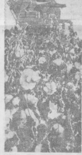
Азамат колхозчиларимиз машинанинг нурадига там бериб «зантори кема»ларга яшил кўл очиб бермондалар. Бўна бошқармасидан «Октябрь 40 йиллиги» колхоз эъзолари ҳам машина теримига натижа аҳамияти беришди. Суратда: машина терими пайти.

Офарин Тошкентим, Улғу, бош кентим, Янги галабалар сенга ёр бўлсин, Эларинг хурраму, ерларинг ғўзал, Бундан ҳам зийда чаманзор бўлсин.