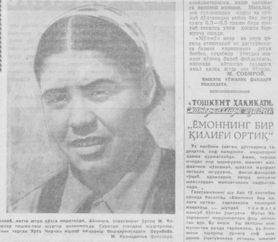
«Тошкент ҳақиқати» газетасида «Эмонинг бир қилиғи ортиқ» мақоласидаги фотосурат.