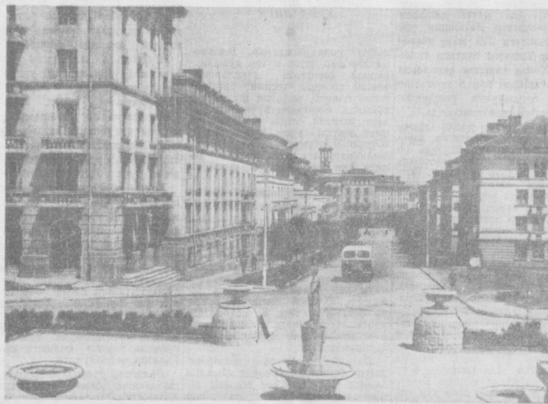
Димитровградда қад кўтарган янги уй-жой бинолари.