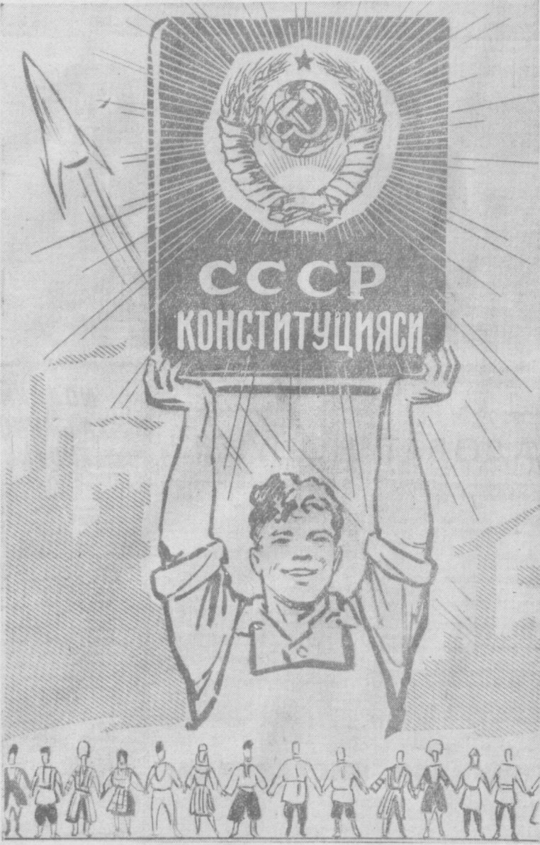
Рассом В. Жарнинов ишлаган плакат.