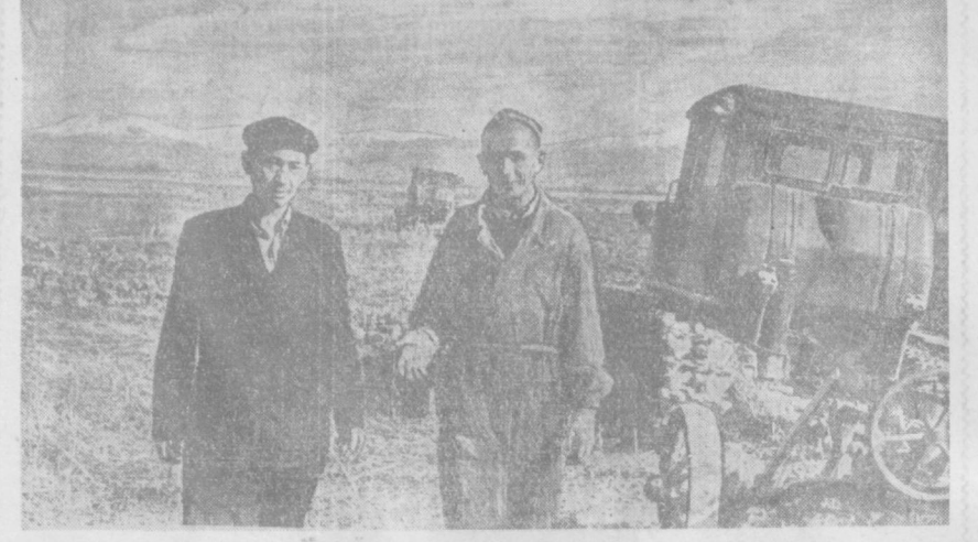
МЕХНАТ ЗАВҚИ. Меҳнат билан шуғулланиш ҳар бир совет ишчисининг шон-шараф ишидир.