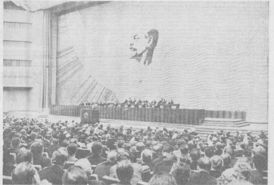
МОСКВА. 9 декабрда Кремлда Совет Иттифоқи Коммунистик партияси Марказий Комитетининг навбатдаги Пленуми очилди. Суратда: Пленум йиғилишида.

КПСС Марказий Комитетининг Пленуми ўз ишини давом эттирмақда.