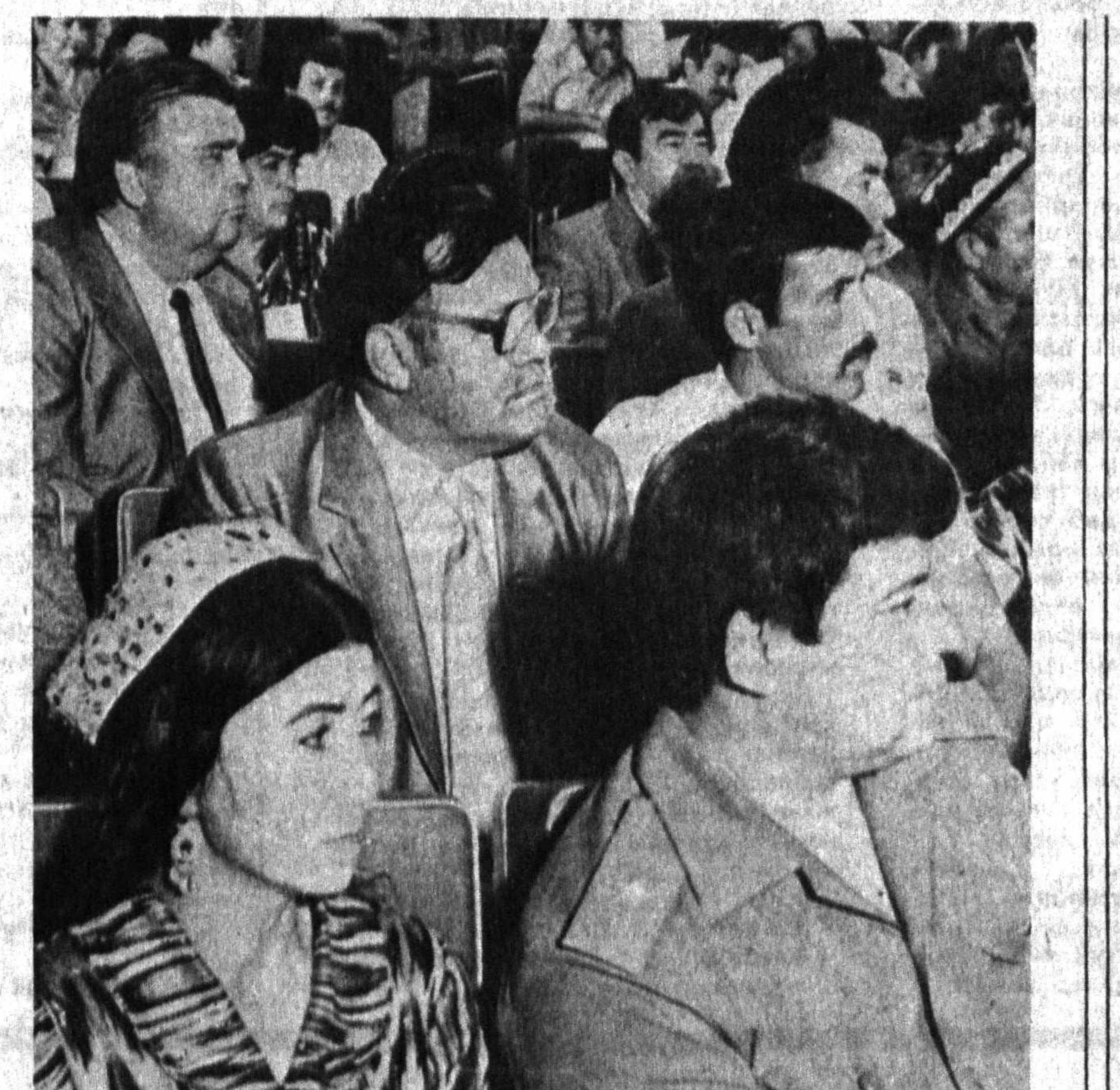
СУРАТЛАРДА: сессиядан лавҳалар.

Ўзбекистон ССР халқ хўжалиги ютуқлари кўргазмасининг кинотомошасида мусиқа оламга яхши ниятлар билан қадам қўётган Ёш созандалар ва уларнинг мураббийлари таширф бўюришган. Бу ерда Ўзбекистон Маданият вазирлиги, Касаба уюшмаси жумҳурият кенгаши ташаббуси билан ўтказилиб, анъанага айланб қолган, пуфлаб чалинувчи созларнинг III жумҳурият кўрик-фестивали бўлиб ўтмоқда эди. Кун тартибидеги режага кўра дастлаб ўзаро баҳслашиш учун саҳнага мактаб ўқувчилари чиқишлари белгиланган. Томошахона ёшлар билан гагжум. Ташкилий қўмита вакилининг гапига қараганда бу йил кўрикда иштирок этиш учун Қорақалпоғистон мухтор жумҳурияти вакилларидан ташқари барча вилоятлардан Ёш созандалар таширф бўюришган экан. Бу шубҳасиз, кўриқнинг йилдан-йилга оммавийлашиб бораётганлигидан далолат беради.