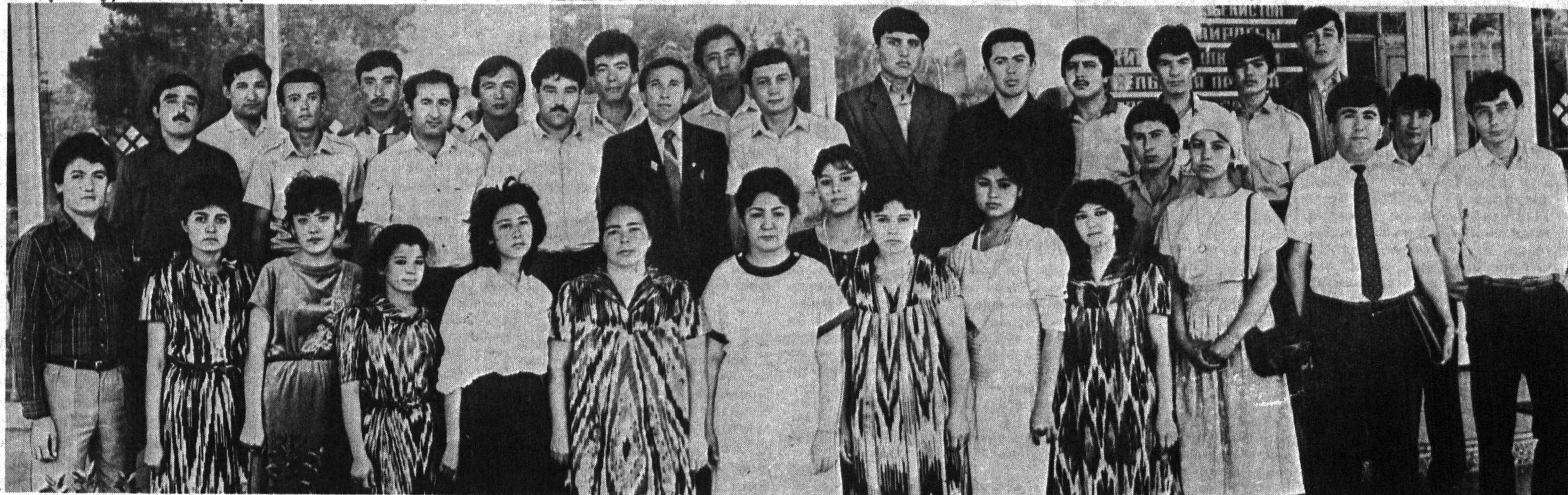
СУРАТДА: дорилфунун битирувчилари.