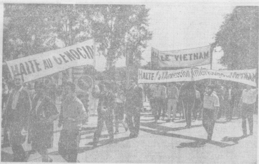
ЖЕНЕВА. Швейцариянинг йирик шаҳарлари Женева ва Лозаннаннинг икки мингга яқин аҳолиси қуршаётган Жанубий Вьетнам халқи билан бирдамлик намойишида иштирок этди. Улар Вьетнамдаги урушни тўхатишни талаб этдилар. Суратда: намойиш пайти.

Пленум Югославия Коммунистлар союзи Марказий Комитети Президиуми ва ижроия комитетининг иши тўғрисидаги ахборотни, мадрлар ҳақидаги сўбат соҳасида Коммунистлар союзининг оғ муҳим заифликлари тўғрисидаги резолюция лойиҳасини, Югославия Коммунистлар союзининг IX съездида делегатлар сайлаш ҳақидаги қарорлар лойиҳасини, Югославия Коммунистлар союзининг 50 йиллиги байрам қилиш программасини ва бошқа масалаларни қарор қилди. (ТАСС).