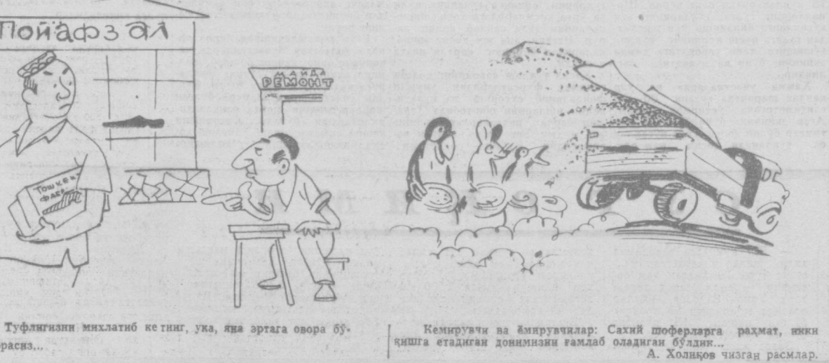
— Туфлигини миҳлатиб кет тинг, ука, қида эртага овора бўлиб юрасиз...

К. ҲАМРОЕВ, «Коммунизм тоғи» газетасининг ходими.