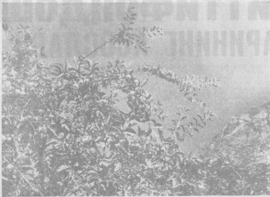
Сервитор тоғлар кучоғиди баҳаво ва ҳушманзара оромқолларда дам олиш кишининг кучига куч қўшади. Шу кунларда Бурҷумулладаги дам олиш уйлари гавжум. Суратда: тоғ этағига жойлашган дам олиш уйланинг манзараларини кўриб турибсиз.