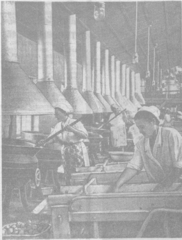
Лигиш консерва заводи коллективи бу йил 30 минг шартли банка консерва тайёрлашди...