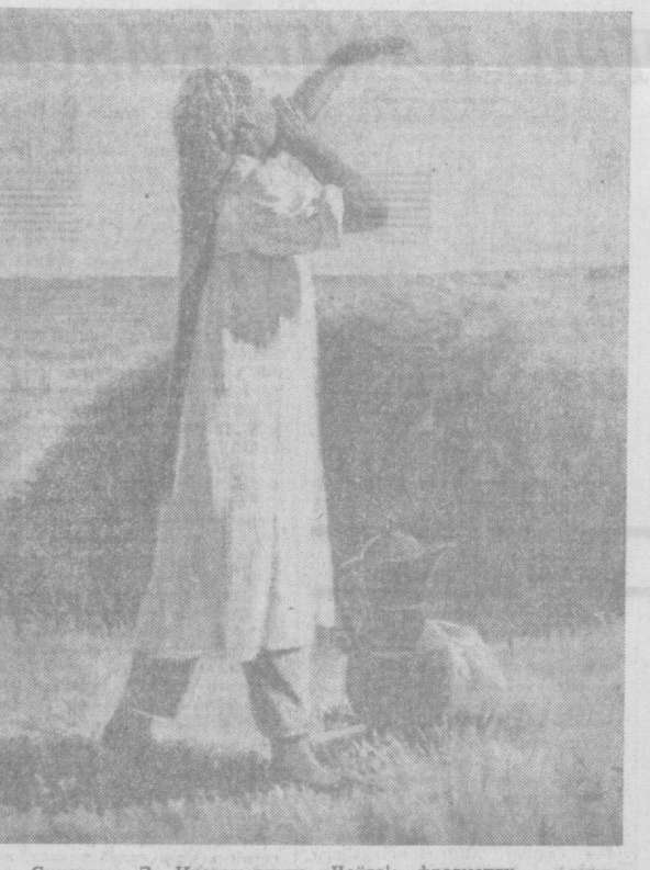
Суратда: З. Иноғомовнинг «Чойга» фрагменти.

3. Иноғомов урушдан қайтиб ижодий иш билан кўш шугулла- на бошлади. Нихоят, 1958 йил- да у Ўзбекистон Рассомлар союзига қабул қилинди.