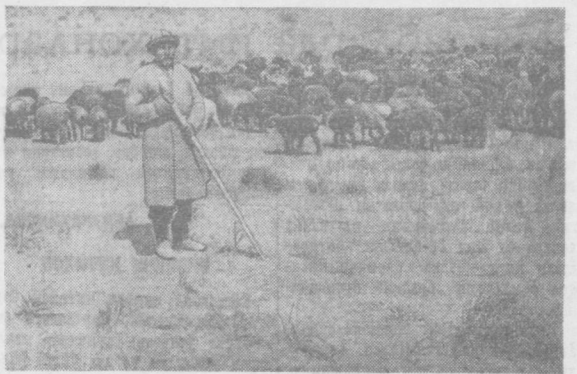
Калинин районидаги Ленин номи колхозда қўйилган йилдан-йилга ривожланиб катталашган «Ленин йили» колхозининг муваффақият билан тугаллади. Суратда: колхознинг Келес массивидан узилган йўлдан.

Хатини ўқиб кўрсатинилар: С. ХУСАНОВ, А. БОҚИЕВ.