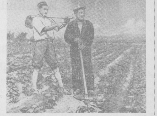
Оржоникиде районидagi «Сталинград» колхозининг 28-мактабда таълим-тарбия ишлари меҳнат билан қўшиб олиб борилади. Мактабда бир неча устaxonа ишлаб турибди. Мактаб биноси атрофида яшнаб турган ва квадрат-уялаб парварини қилинаётган гўзалар ўқувчиларнинг меҳнати билан гуркираб ўсиб, қий-ғос шонага кирди.