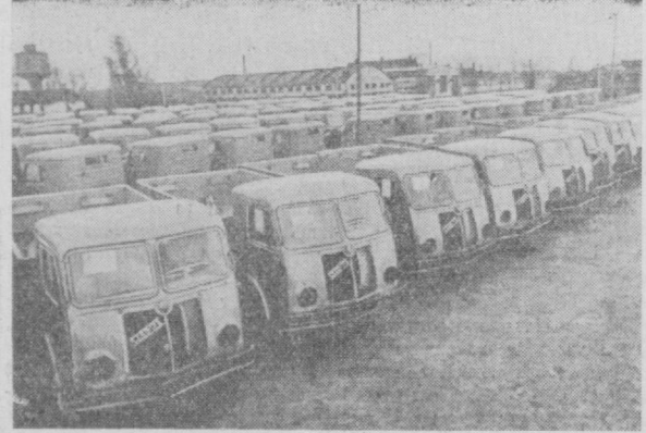
Польша Халқ Республикаси. Суратда: Стараховицадаги юк машинаси заводи ишлаб чиқарган «Стар» юк автомобиллари.

Венгрияда аҳоли учун квартиралар қурилиши кенг авж олдирилмоқда. УИ-жон қурилиши программасига кўра бу йил 38 мингтага яқин квартира фойдаланиш учун топширилади. Венгрия бинокорлари ўз олдларига қўйилган вазифани яхши ба-