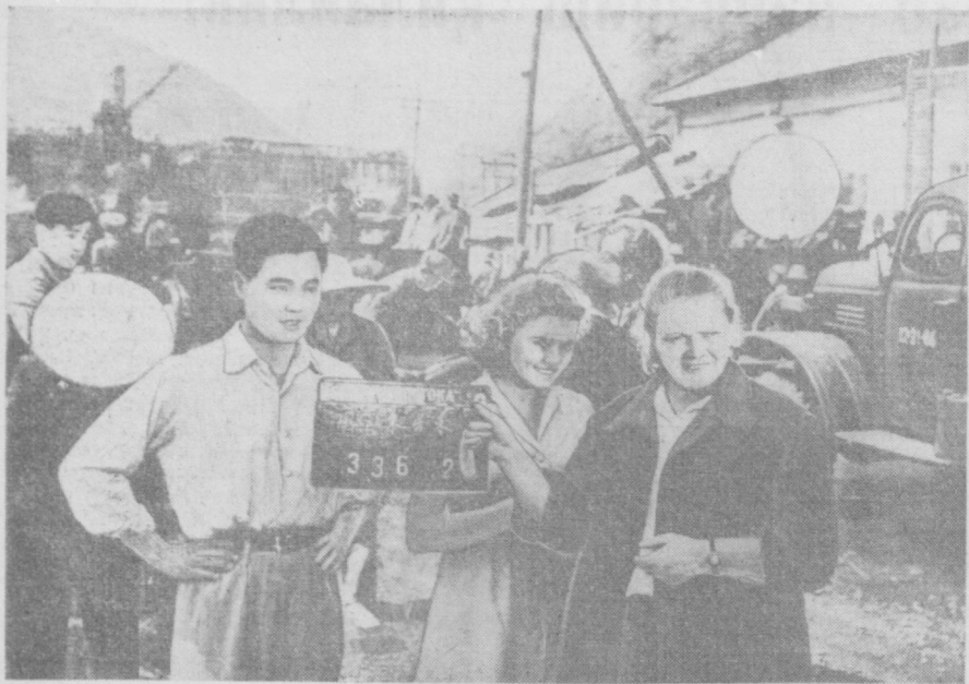
Хитой Халқ Республикаси. Чжэнь провинциясидаги Синьаньда қурилатган гидростанциянинг майдонда фильм сурати олиноқда. Бу фильм яратилган «Мосфильм» студияси ва Хитой Чанчунг киностудияси қатнашмоқда. Кинокартина Хитой Халқ Республикаси ташкил этилган 10 йиллик кунига бағишланган чикарилади. Бу бадий полотно икки буюк халқ — хитой ва СССР халқларининг дўстлиги ҳақида ҳикоя қилади. Суратда: фильмни суратга олиш пайти.