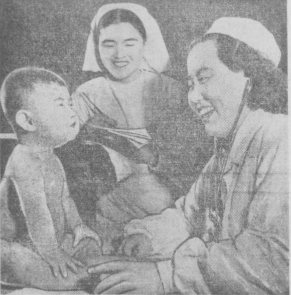
Корея Халқ Демократик Республикаси. Суратда: Пхенья тўқимачилик комбинатининг амбулаториясида.

тасида босиб чикди. Бу мақолада қишлоқ хўжалигини кооперативлаштиришдаги муваффақиятлар кўрсатиб ўтилади. Ишлаб чиқариш-кооператив ҳаракати шу йил кўламада жуда ривожланиб кетганлиги натижасида деб ёзда, жумладан, Иштван Доби, ишлаб чиқариш кооперативларининг ва ишлаб