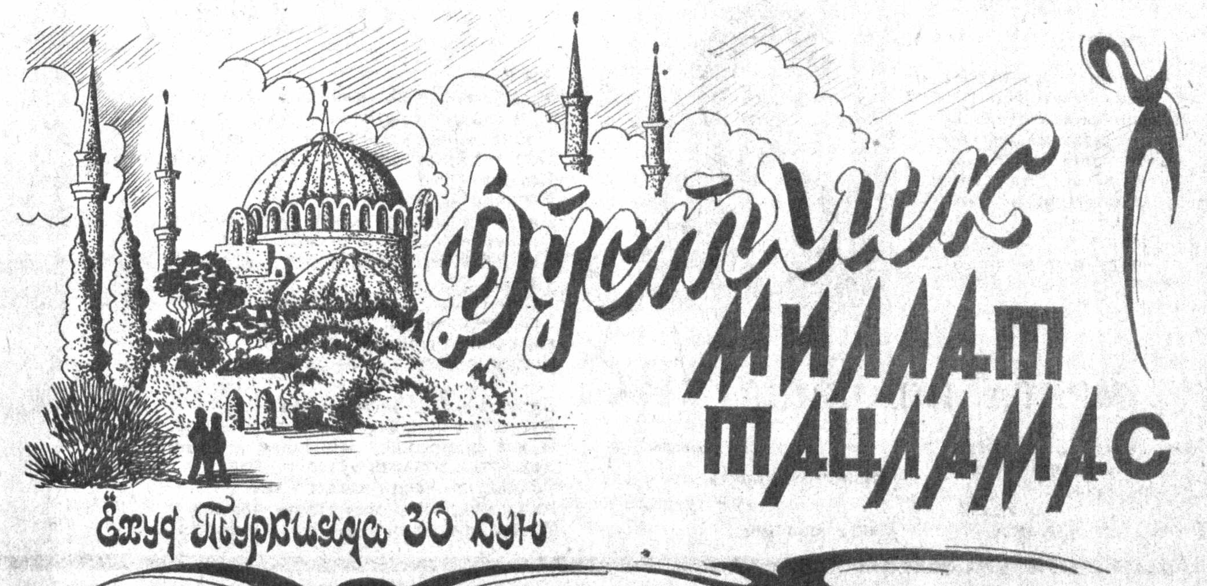
Бозор Туркияда 30 кун

юксак даражада қўллаб-қувватланмоқда. Савол берилган кишиларнинг 82 фоизи Оқ уй бошқарувидаги тангликка ҳазирга ёндашуви тўғрисидаги фикрларини бартараф этишнинг тинч воситаларини бутунлай рад этгани, деган гап эмас.