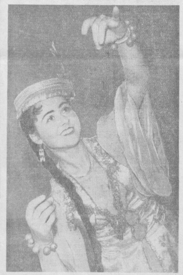
«ПАХТА РАҚСИ»

— Баракалла қизим, мана иш деган мундоқ бўпти. Машина жоннинг роҳати деб шуни айтадилар-да, а Шокиржон? Улар хайрлашиб узоқлашиб кетган. Дилбар ўзига келди. — Қандай олижаноб, қандай саховатли бу оламлар-а! Ахир, мен мақтагудек иш қилганим йўқ-ку, булар бўлса... — Дилбарнинг хайлидан ўтди. — Албатта уларнинг бу ишончини оқлаш керак! — У машина томон йўл олди. Дилбар «зангори кемага» ўтириб, кенг пахтазор денгизин кўчугина кириб кетди. Уни эфр ватапарварлик ҳисси, шундай олижаноб бўлган.