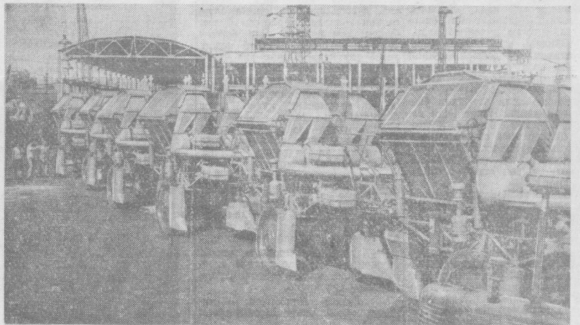
«Ташельс' маш» заводи пахтакор хўжаликларга ҳар кунини ўйлаб пахта териш машиналари жўнатиб турибди.