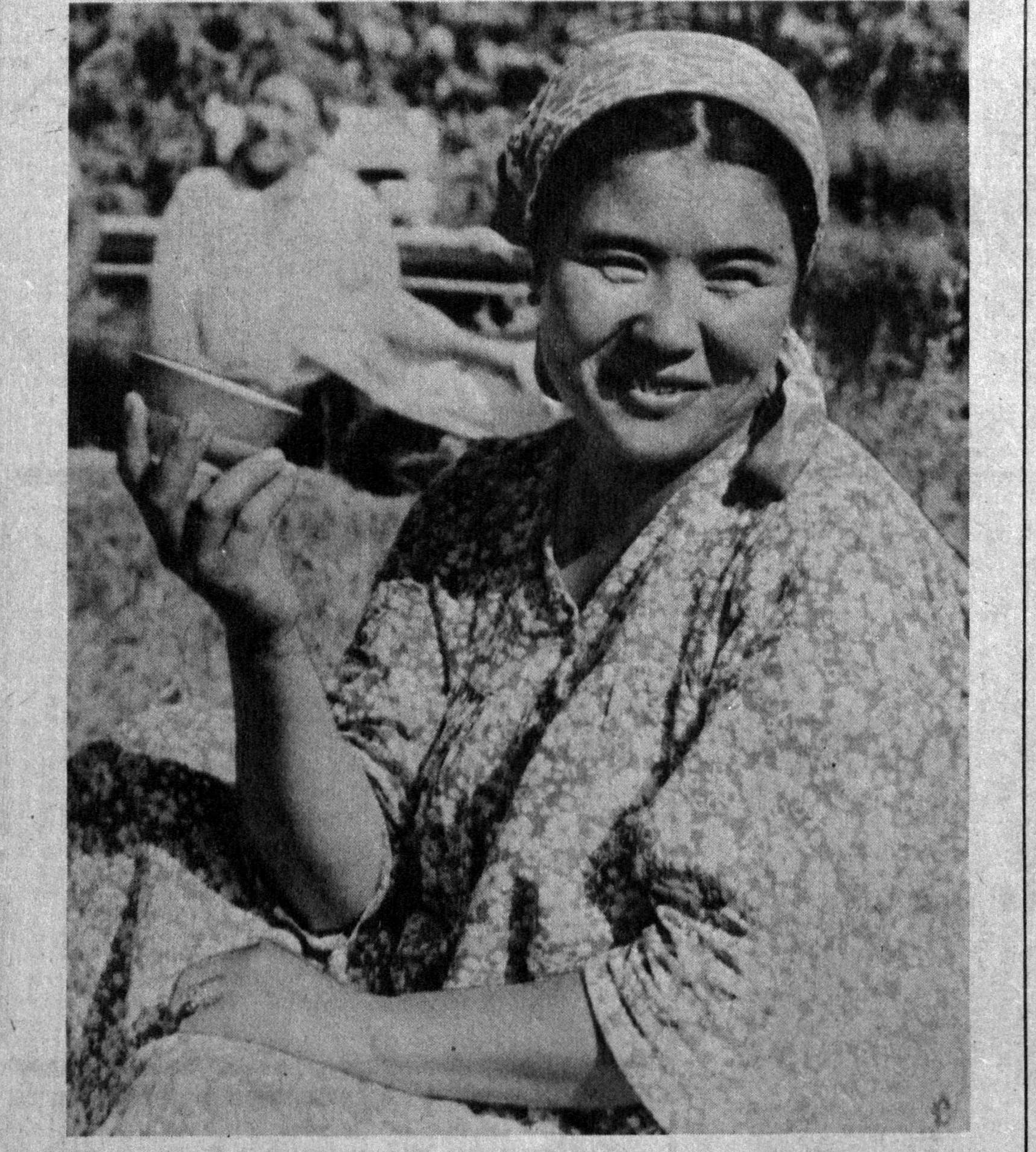
Хайрият, яхши нуқлар келаяпти. Ҳарна бўлсада, ўз меҳнати қадр топмаганини, 70 йилдан кўпроқ вақт мобайнида...