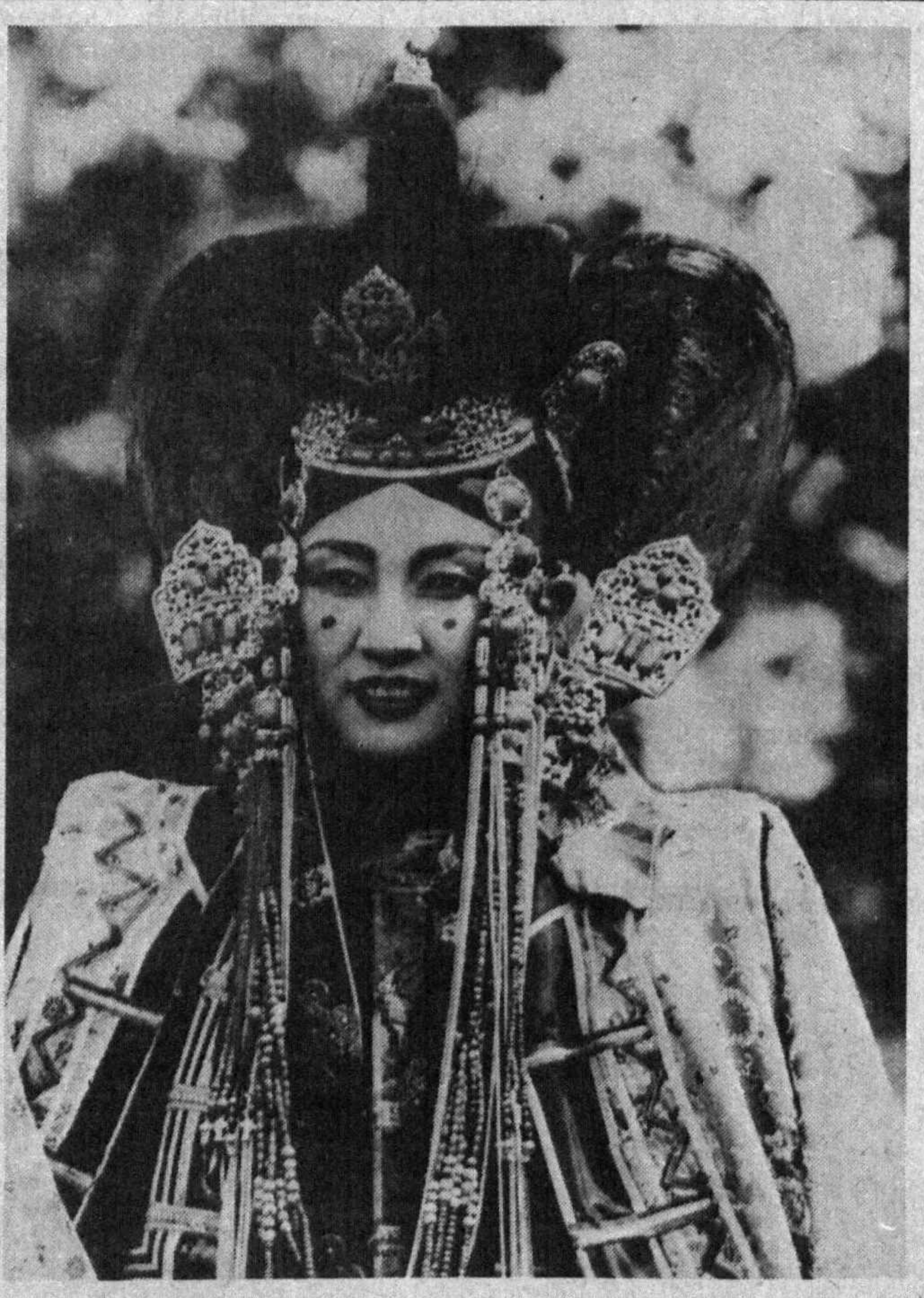
«МОН ПАМЭ» агентлигининг хабар беришига кўра Мўғулистанда 20 га яқин миллат яшайди. СУРАТДА: Халқ миллатига мансуб бу аёл қадимги миллий кийимда.

ГАВАНА (ТАСС мухбири Сергей КУТИКОВ). Сешанба кунин Гаванада кубалик ўн бир киши устидан суд бошланди. Улар террорчиликка, исёнга тайёргарлик кўриш, қурол ва портловчи моддаларни яшириш тарзда сақлаётганликда айбонандилар.