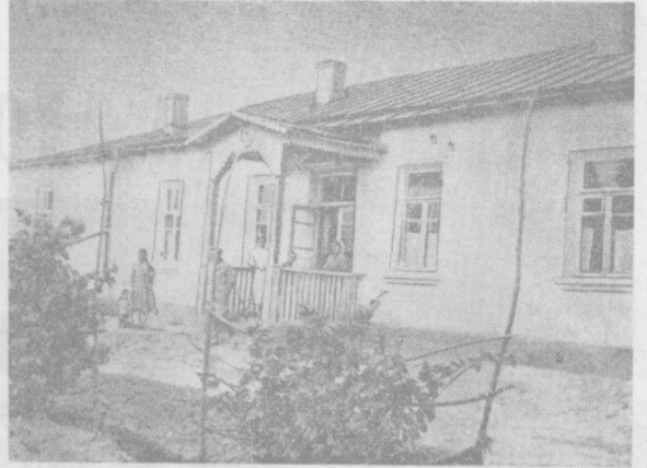
Оржоникидзе районидagi «Сталинград» колхозида юрак ошқоран, тери ва ўлка шамоллаши касаллиқларининг давловчи шифохона қурилиб, ишга туширилди. Малакали медицина ходимлари ва зарур асбоб-ускуна, дори дармонлар билан таъминланган бу шифохона қишлоқ меҳнаткашларига ахши хизмат қўрсатмоқда. Сурафта: шифохона биносининг умумий кўриниши.

УЛАН-БАТОР, 16 август. (ТАСС). Халхин-Гол дарёси районда совет мўғул кўролли кучлари япон империяликлари устидан ғалаба қозongan кўннинг йигирма йиллиги муносабати билан ўтказилаётган тантаналарда қатнашини учун совет делегацияси бу ерга келди. КПСС Иркутск область комитетининг биринчи секретари С. Н. Шчетинини делегацияга бошчилик қилди. Делегация составида Туркистон Ҳарбий округи кўшинлари қўмондони И. И. Федюнинский, Ленинград Ҳарбий округи Ҳарбий кенгашининг аъзоси генерал-лейтенант В. В. Цибенко, ДОСААФ Марказий Комитети раисининг ўринбосари, авиация генерал-лейтенанти Т. Ф. Куцевалов, «Агитатор» журналининг бош редактори, Совет-Мўғулистон дўстлиги жамияти раисининг аъзоси С. Н. Новиковлар бор.