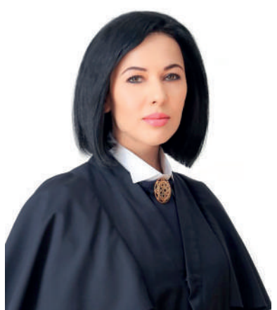
Таслима АННАЕВА, Олий суд судьяси