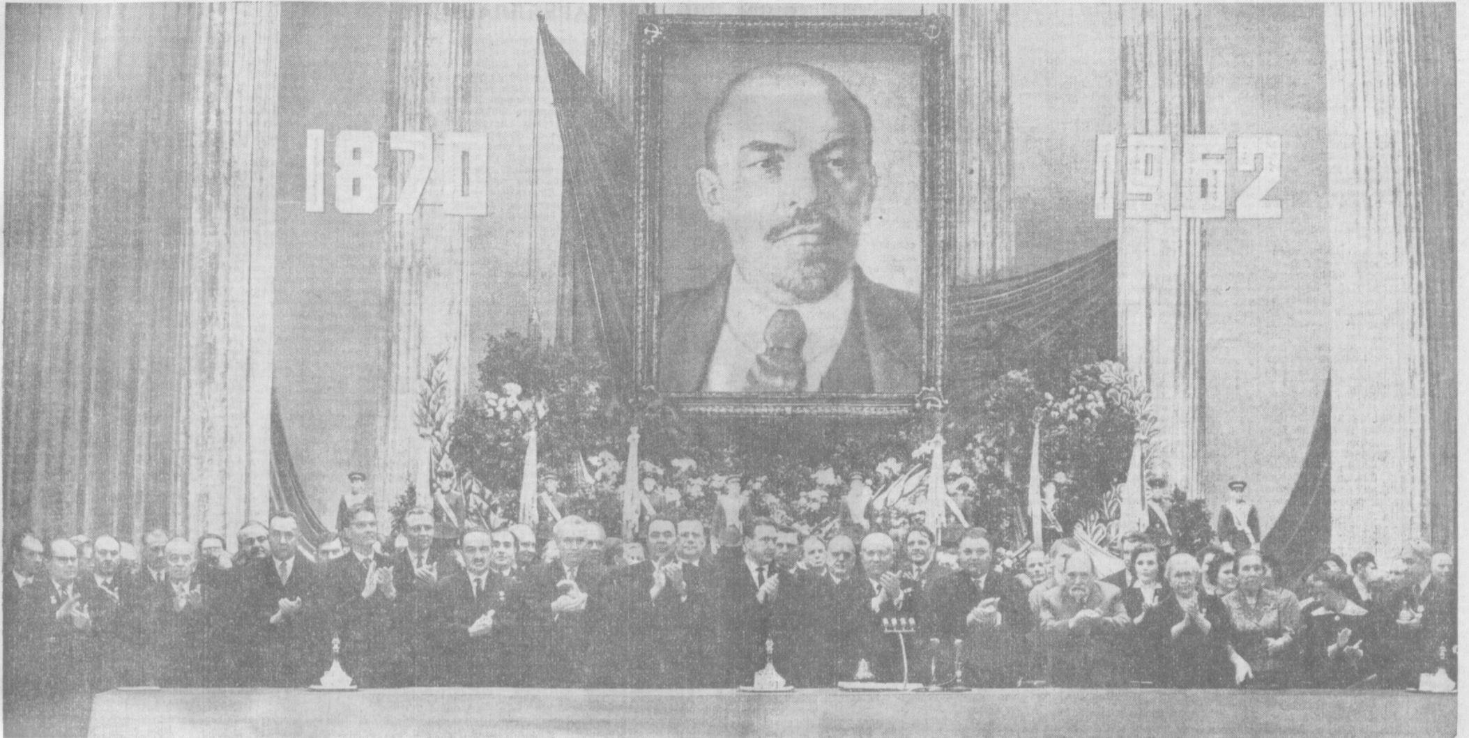
Москва, СССР Большой театри, 1962 йил 22 апрель, Владимир Ильич Ленин туғилган кунинг 92 йиллигига бағишланган тантанали мажлис президиумида.

Яшасин улуғ революцион таълимот, бутун дунё меҳнат- нашларининг қудратли ғоявий қуроли — марксизм-ленинизм!