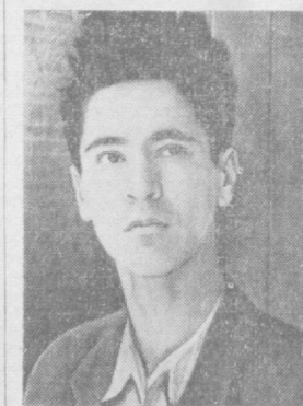
Мана, фрибгарнинг афти-анғори.

«Илҳом» тутиб қолса бўлади! Бирон нарсани ундириш умиди, балою нафас уни 113-магазин прилавкасига яқинлаштиради.