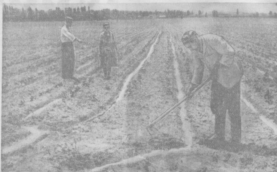
3-бригаданинг моҳир сувчиси ўртоқ Аҳмад Тиламов жуякларга сув тарамоқда.

Бундан ташқари 1800 тонна гўнгни чиритиб тайёрлаб қўйганмиз. Бунинг 1 июлдан бошлаб машиналар билан ғўза қаторлари орасига солаемиз. Гўн шона ва тугунчаларни сақлаб қолиш, уларни