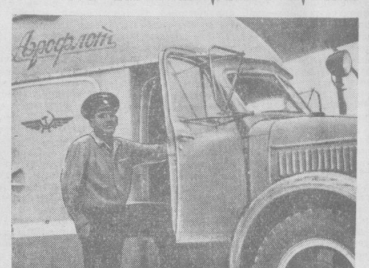
Суратда: Кондиционер машина.

ТУ—104 ҳаво кемаи олдида «Аэрофлот» сўзи ёзилган усти ёпиқ машина келиб тўхтади.