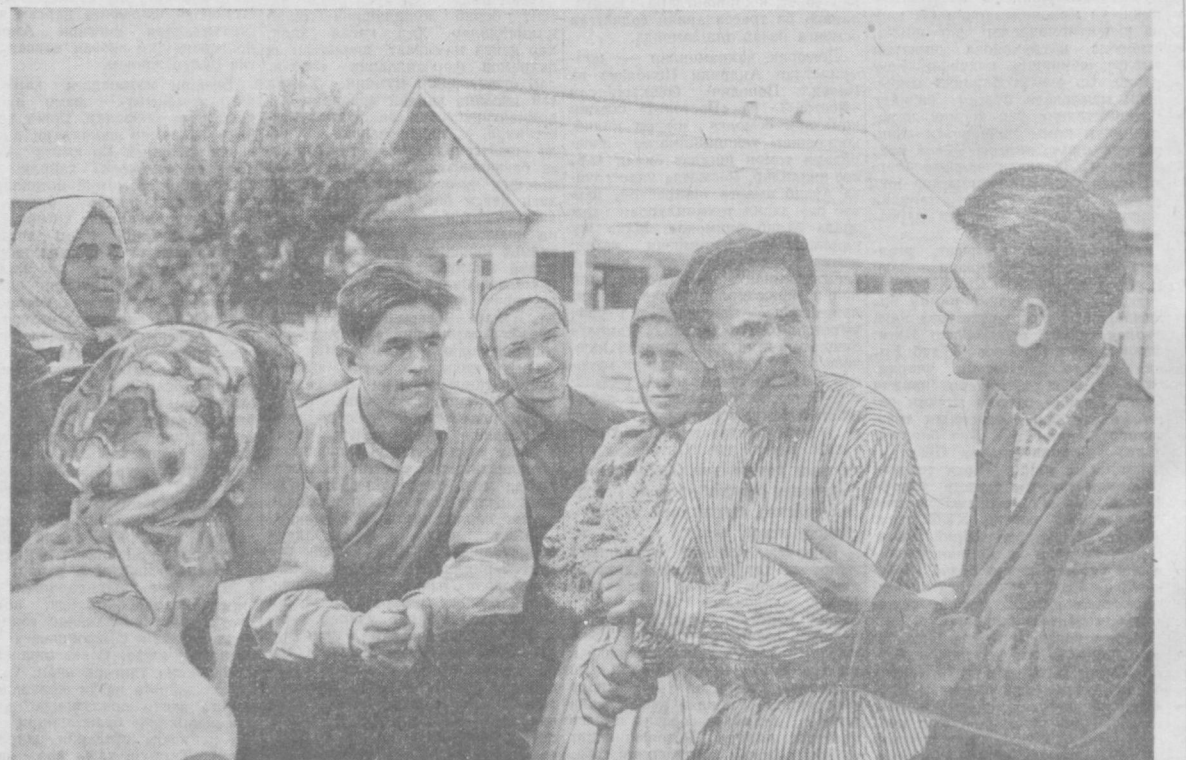
Космонавт А. Г. Николаевнинг ватани — Чувашистон қишлоғи Шоршеллида. Суратда: космонавтнинг акиси ўрмон санаот ҳўжа-лигининг мастери Иван Григорьевич (ўнгда) «Восток-3» космик кемаси учирилган кунда қаҳрамоннинг ҳамкиноларини билан сўхбат-лашмоқда.

Стелпа Павлович ТИТОВ, Подольниково (Олтой ўлкаси), 13 август. (ТАСС).