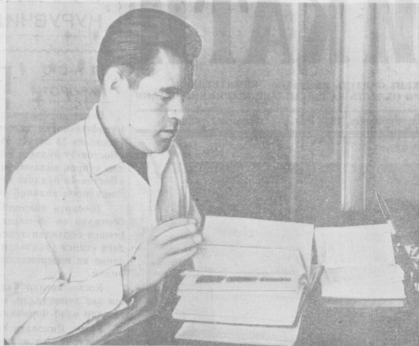
Совет Иттифоқининг учувчи, космонавти майор А. Г. Николаев, Вера Жихаренко фотоси. (ТАСС фотохроникаси).

„Юлдузлар сари бораётганлар“ китобидан парчалар