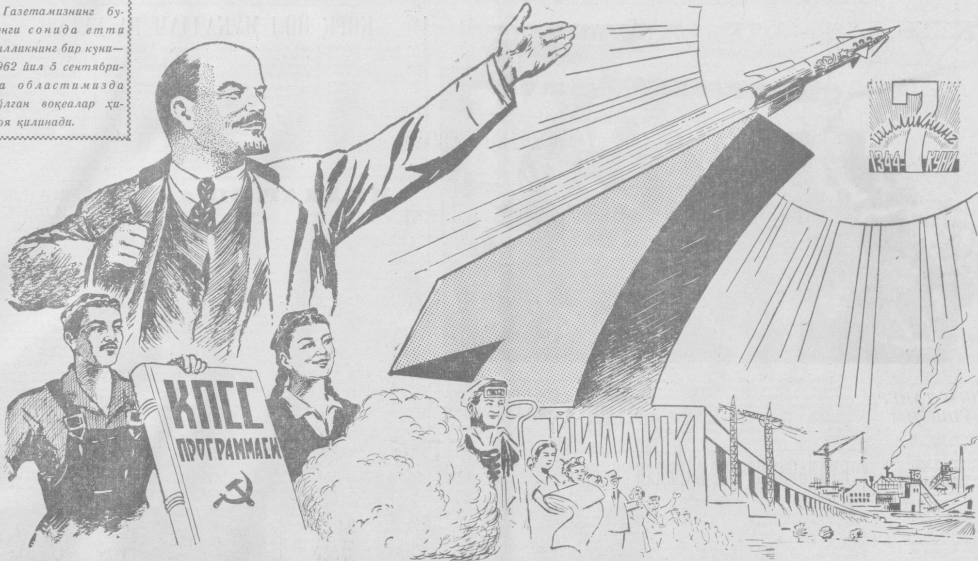
А. Ҳолиқов ишлаган расм.

Газетамизнинг бугунги сонидан етти йилликнинг бир куни — 1962 йил 5 сентябрда областимизда бўлган воқеалар ҳикоя қилинади.