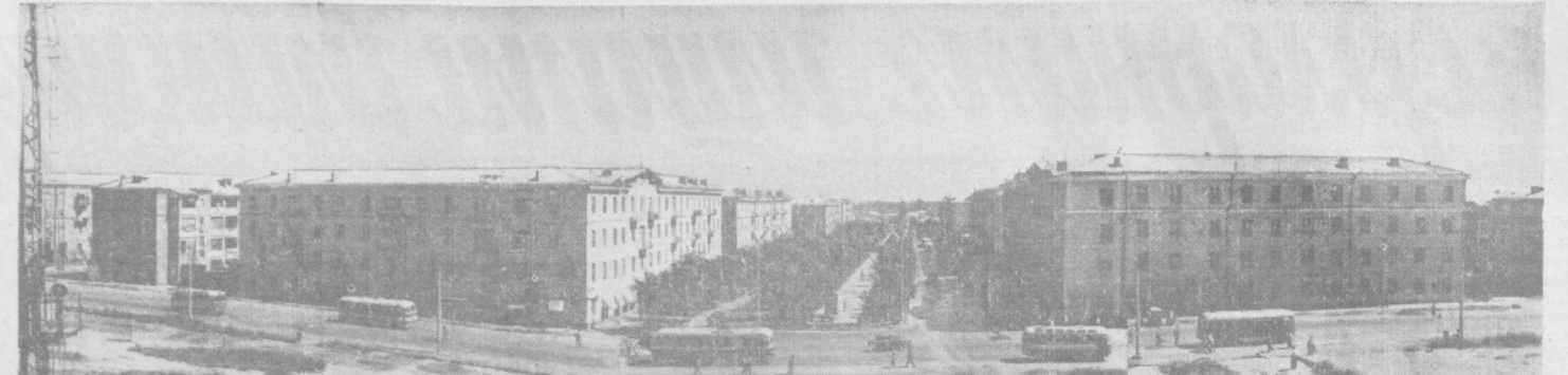
Тошкент Черемушки — Чиланзорнинг баркамол, хуснига бугун боқиб тўймайсиз. Бу ерда ҳар кун камиди 10—12 оила бешати таррадувди. Иккинчи суратда: массивдаги Ю. А. Гагарин номига қўйилган кўчанинг кўришиши.