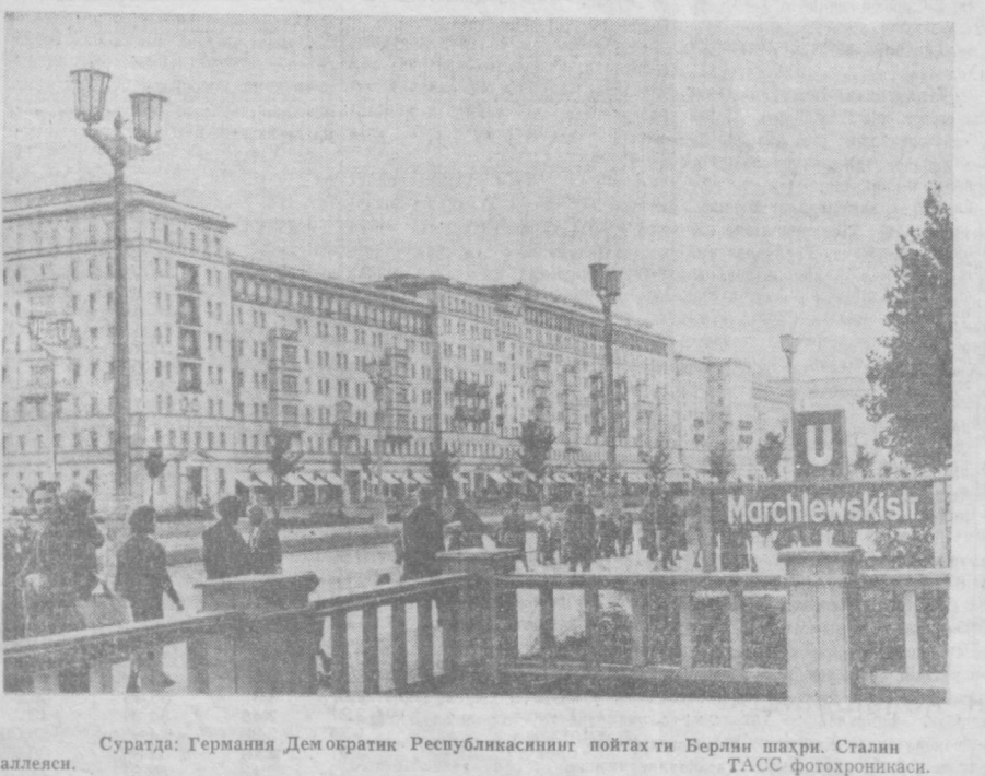
Суратда: Германия Демократик Республикасининг пойтахти Берлин шаҳри. Сталин аллееси.

Янги жамиятнинг биринчи спартакиадаси Спорт жамиятлари ва ташкилотлари союзи республика Совети ҳузуринда янги «Еш куч» жамияти тузилган эди. Сентабр ойида ана шу энг ёш жамиятининг 1-спартакиадаси ўтказилди.