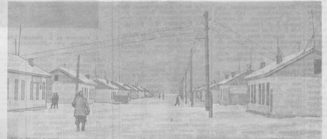
Янги шаҳар қурилиши бошланганига ҳали кўп вақт бўлгани йўқ. Лекин ҳозирдаёқ бу ерда кўплай уй-жой, маданий-маиший бинолар қад кўтарётёр. Суратда: Қурувчилар шаҳарасидаги янги кўча.