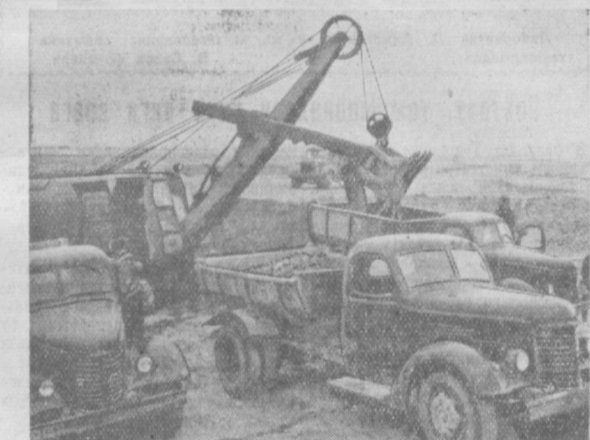
Юзлаб самосвал ва экскаваторлар шундаги жуда кўп қурилишларни тош-шағал билан таъминламоқда. Суратда: Қарьерда самосвалларга тош-шағал ортиш пайти.