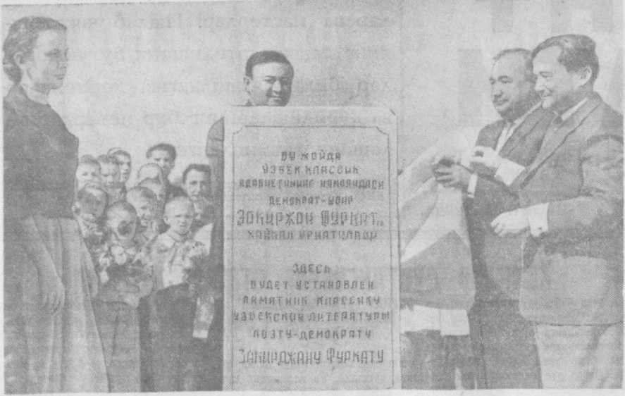
Кеча пойтахтнинг Чилонзор массивида ўзбек адабиётининг классиги, атоқли демократ шоир...