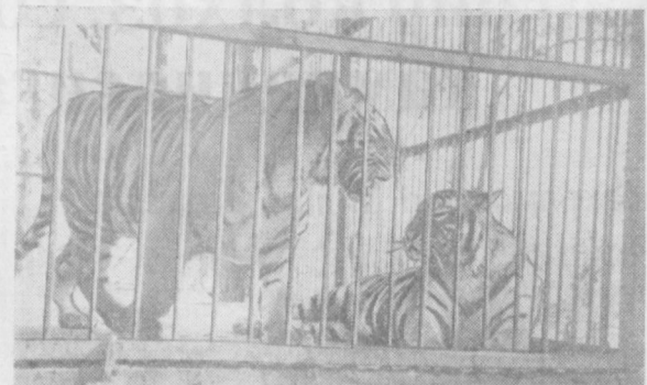
Тошкентнинг об-ҳавосида — эзда ҳам, қишда ҳам уларни соғлом ва тетик хис қилмоқдалар. Мана, ҳозир ўлкамизда навбахорнинг илиқ шабодаси эсмоқда. Қиш бўйи иссиқ хонада яшаган «Радж» ва «Рани» энди ҳайвонот боғидаги ўзининг баҳаво манзилга чиқарилди. Улар яхши парварши қилинмоқда. Чапдаги суратда: оқ айиқлар.

Ушдаги суратда, сиз «Радж» ва «Рани» лақабли йўлбарсларни кўрасиз. Бу йўлбарслар 1955 йил декабрь ойида Хиндистондан Тошкент ҳайвонот боғига келтирилган эди.