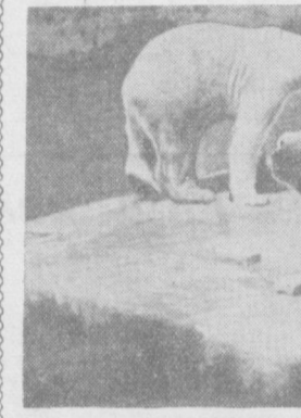
Тошкентнинг об-ҳавосида — эзда ҳам, қишда ҳам уларни соғлом ва тетик хис қилмоқдалар. Мана, ҳозир ўлкамизда навбахорнинг илиқ шабодаси эсмоқда. Қиш бўйи иссиқ хонада яшаган «Радж» ва «Рани» энди ҳайвонот боғидаги ўзининг баҳаво манзилга чиқарилди. Улар яхши парварши қилинмоқда. Чапдаги суратда: оқ айиқлар.