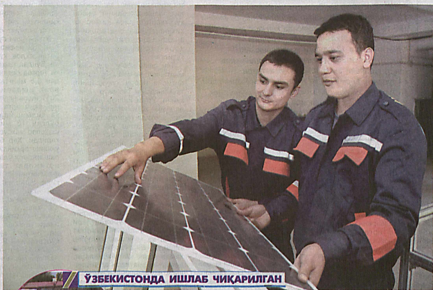
Ўзбекистонда ишлаб чиқарилган