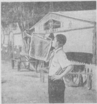
Тарбияланувчиларни линейкага чақирди.