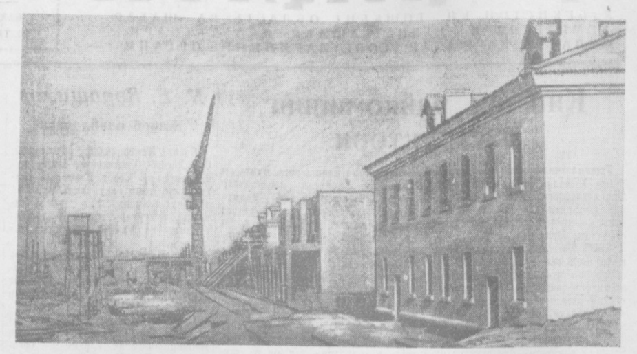
Шаҳарда кўп қаватли бинолар қурилиши кундан-кунга авж олаётир. Суратда: икки қаватли ту-рар-жой бинолари қурилиши.