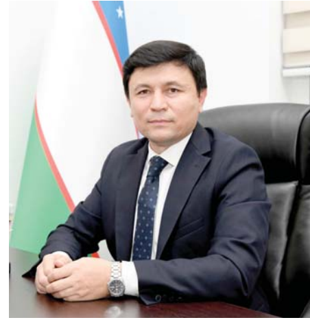
высшего образования, повышению качества образования.

В данной сфере целесообразно применять опыт Финляндии. Финны создали игровые цифровые онлайн-платформы, которые делают