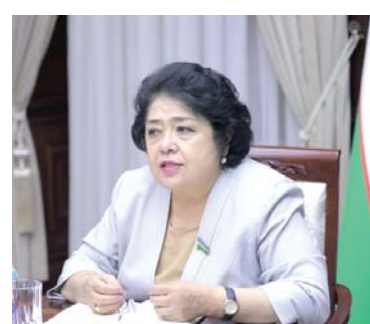
государственной власти на местах».

Для полноценной реализации положений обновленного Основного закона, устранения сложностей в деятельности органов государственной власти на местах, обеспечения системности законодательства принят Указ Президента «О мерах по повышению эффективности деятельности органов