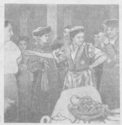
МОСКВА. Бутуниттифоқ қишлоқ ҳўжалик выставкаси территориясида — «Қовун сайли» ўтказилди. Бунда чет эл мамлакатлари ва Совет Иттифоқининг республикаларидан келган мингдан ортиқ меҳмонлар қатнашди. Сайл ташкилотчилари булган Ўзбекистон ССР делегатлари ўз дўстларини қовун, тарауз, узум ҳамда Ўзбекистонда етиштирилган бошқа мевалар билан меҳмон қилдилар. «Қовун сайли» қатнашчилари ярим кечагача ҳўшчақчилик билан вақт ўтказдилар. Суратда: Ўзбекистон ССР павильонидидаги «Қовун сайли» вақти.

турizm билан ва жоңагон ўлка бўйлаб сабат қилиш билан шугулланаётганини айтди. Лукумат ёшларнинг оқилона дам олишини уюштириш тўғрисида гўмхўрлик қилмоқда. талим лагерлари, турист базалари ва станциялари ташкил қилиш учун кўп маблаг ажратмоқда. СССР ва Чехословакия вакиллари ўз мамлакатларида туризмнинг кенг ривожлантирилганини, спортчиларга гўмхўрлик қилинаётганини ҳақида гапирдилар.