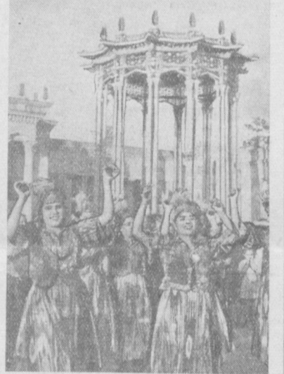
МОСКВА. Суратда: Ўзбекистон ССР павильонидида «Қовун сайли» вақтидаги ўйин.

— Африка халқлари мустамакачиликка қарши муқддас урунга отланмоқдалар. Деярлик қуролсиз Жаҳон халқи ҳозирги вақтда Франциянинг олтин миң соатда иборат армиясига қаршилик кўрсатмоқда. Аммо биз озодлик йўлидаги курашимизда яққа эмасиз ва бу курашини ғалаба қозонувчи давом эттирамиз.