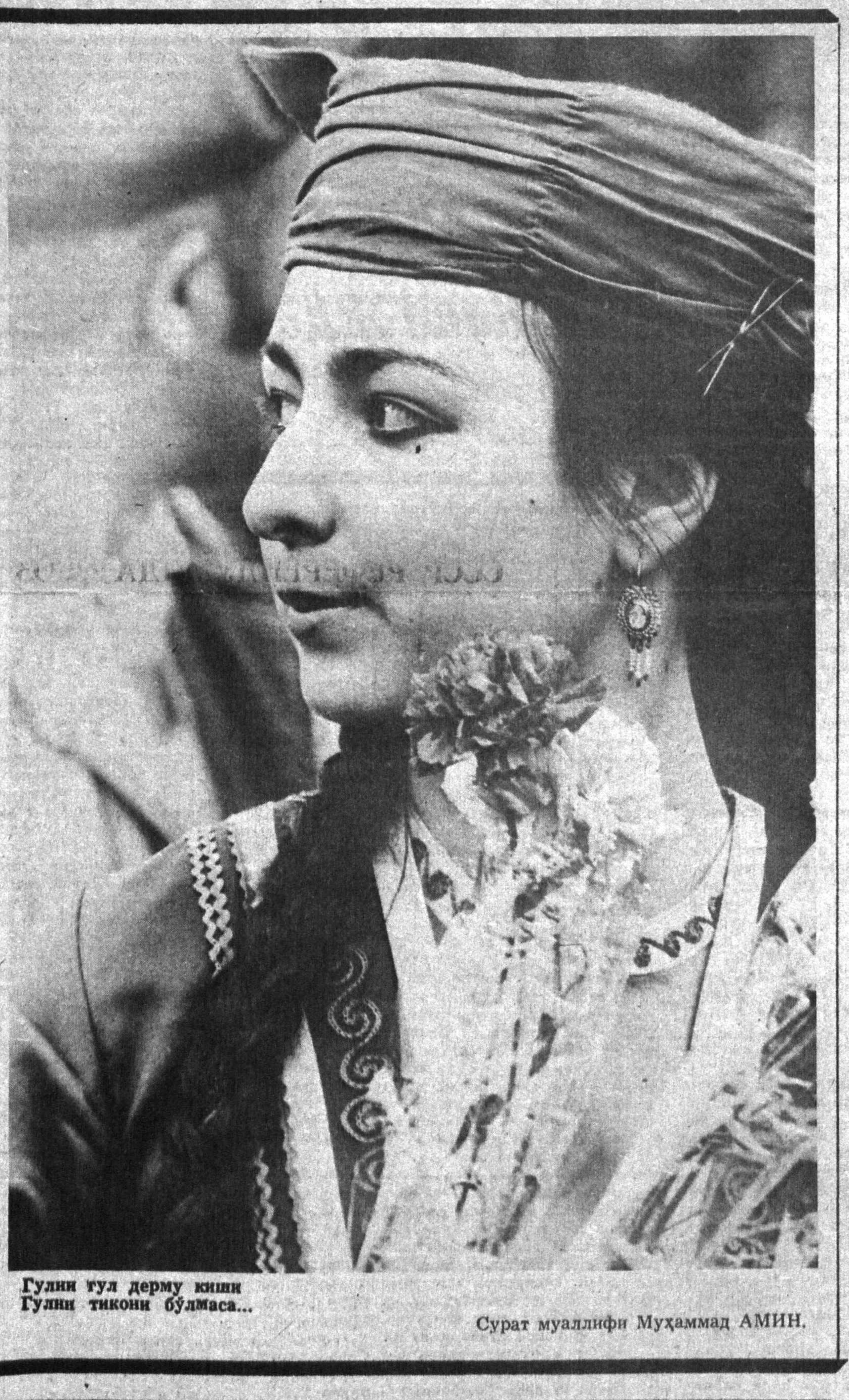
Гулнору гулдерму киши Гулли тукон бўлмади...

Ушадан буваининг гапларига ишонганимди. Орадан тўққиз йил ўтди. Армия хизматини