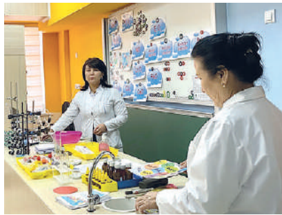
Президент қарори билан «ТАЪЛИМ СОҲАСИДАГИ ЛОЙИХАЛАР МАРКАЗИ» лойиҳа офиси ташкил этилди.