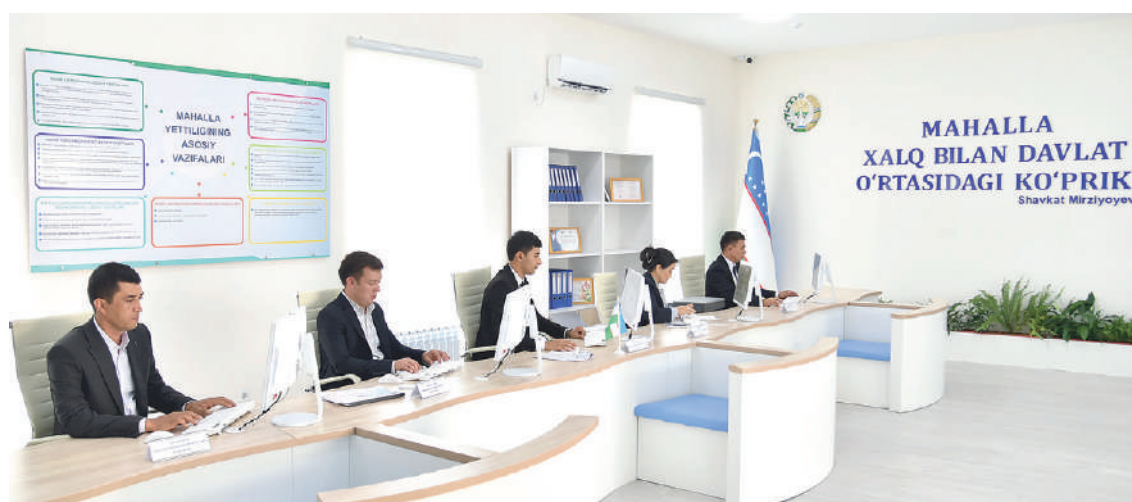
Қашқадарё вилояти Қарши шаҳридаги “Ойдин” маҳалла фуқаролар йиғини ходимлари.

Кредит, субсидия ажратиш билан боғлиқ масалалар маҳалланинг ўзида ҳал этилар экан, раиснинг молия соҳасидан хабардор бўлиши, иқтисодчи каби фикрлаши муҳим аҳамиятга эга.