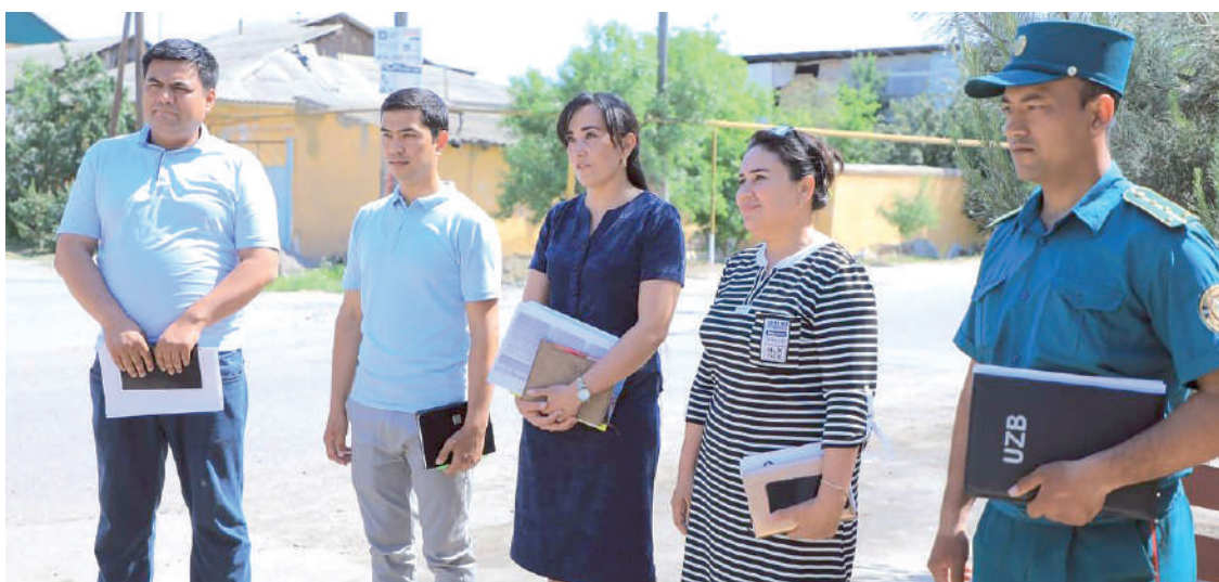
"Маҳалла еттилиги" вакиллари тайинлашда шу ерлик номзодларга устуворлик берилди.

Б ирок замон шиддати бир жойда тўхтаб турмайди, ҳозирги давр янги-янги талабларни олдимишга қўймоқда. Бу жараёнда фақатгина ташкилотчи, ташаббускор бўлиш билан иш битмайди. "Маҳалла еттилиги" ташкил этилиб, фуқаролар йиғинининг молиявий имкониятлари оширилаётган, аҳолига 70 дан ортиқ ижтимоий ёрдамлар (моддий ёрдам, субсидия учун тавсиянома, кафилик ва бошқалар) маҳалланинг ўзида кўрсатилиши йўлга қўйилаётган экан, эндиликда маҳалла раиси ишбилармон, ҳар ишининг кўзини билладиган мутахассис бўлиши керак.