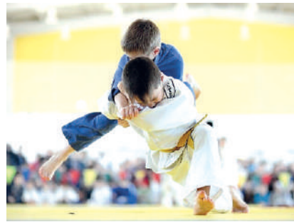
“СЕКТОР – ТУМАН – ВИЛОЯТ – РЕСПУБЛИКА” даражаларида оммавий спорт мусобақалари ўтказилади.