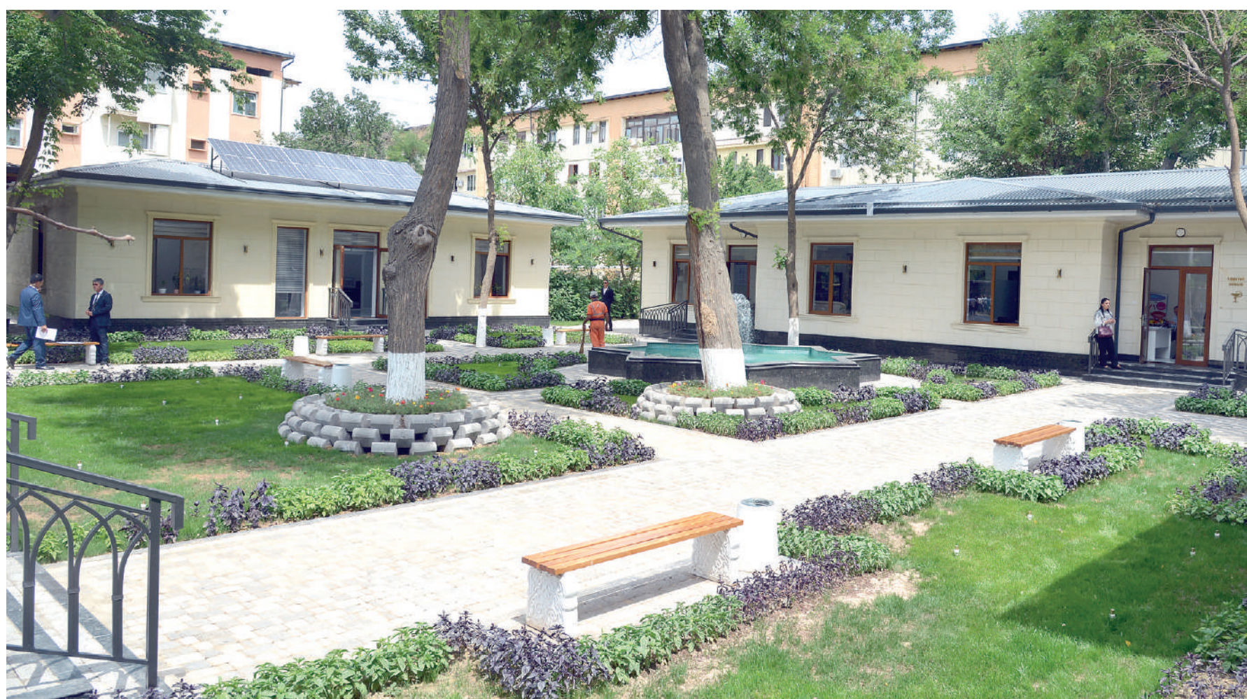
Тошкент шаҳар Шайхонтоҳур туманидаги “Жангоҳ” маҳалла фуқаролар йиғини биноси.

Бугунги раис ишбилармон бўлмаса, ходимлар бошқа худуддан тайинланса, маҳалла иши қийинлашади, боқимандалик кайфияти ошади