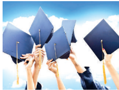
Президент қарорига кўра, бакалаврият бўйича 3 йиллик ТАЪЛИМ ДАСТУРЛАРИ асосида кадрлар тайёрланади.