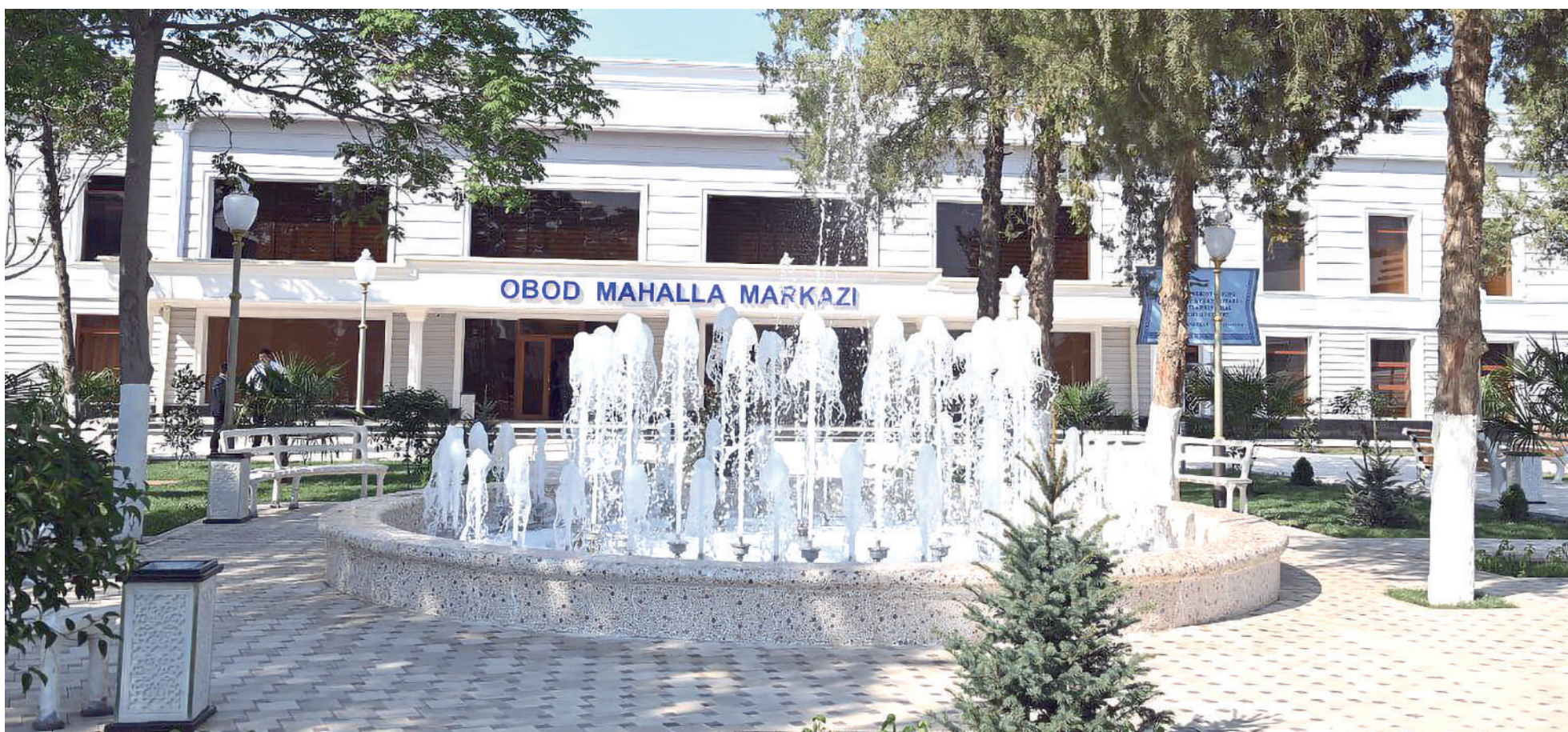
Қашқадарё вилояти Касби туманидаги "Қамаши" маҳалла фуқаролар йиғини биноси.

Термиз шаҳрида ЙИРИК ҲАЖМЛИ ВА ОФИР ВАЗНЛИ транспорт воситаларининг ҳаракати чекланди.