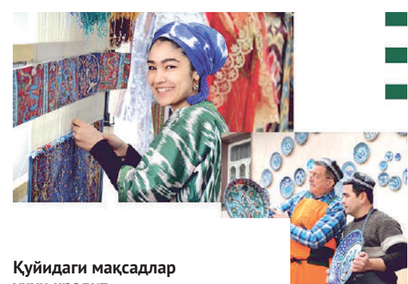
Куйидаги мақсадлар учун кредит ажратилмайди:

аввал ажратилган кредитлардан мақсадсиз фойдаланилганда;