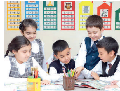
“МАКТАБ – ОТА-ОНА – МАҲАЛЛА” занжири асосида электрон мулоқот платформаси ишга туширилади.