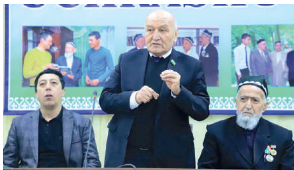
Нуронийлар ҳаёт тажрибаси ёшлар учун хамиша ибрат мактаби.

Нуронийлар ҳаёт тажрибаси ёшлар учун хамиша ибрат мактаби. Аиниқса, уларнинг қимматли панд-насихатлари, умр сабоқлари келажакимиз эгаларининг ватанпарварлик руҳида тарбияла-